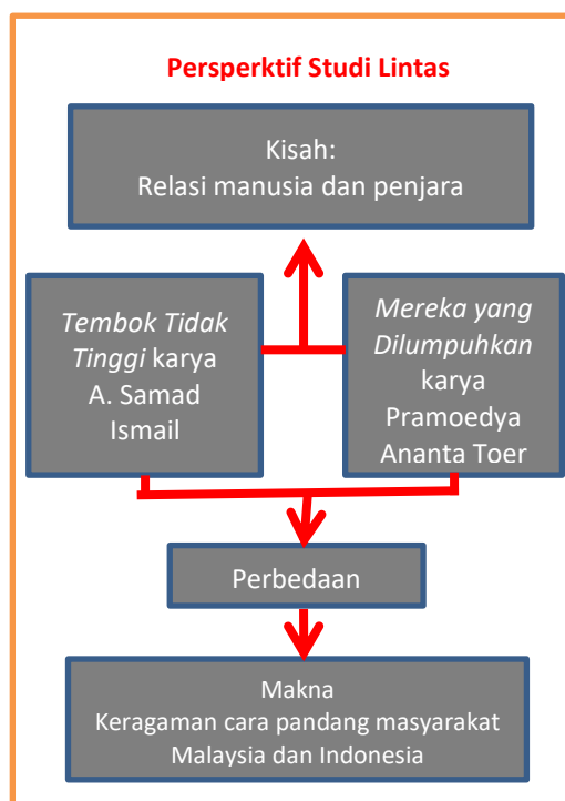
Gambar 1. Model Kajian Sastra Bandingan Berperspektif Lintas Budaya dalam Penelitian Faruk HT

Ada beberapa hal yang harus diperhatikan dalam penelitian Faruk. Pertama, Faruk melatarbelakangi penelitiannya dengan melihat kondisi sosial, politik, dan kebudayaan Indonesia-Malaysia. Inilah yang menjadi pijakan dalam memilih dan mengkaji dua novel tersebut.