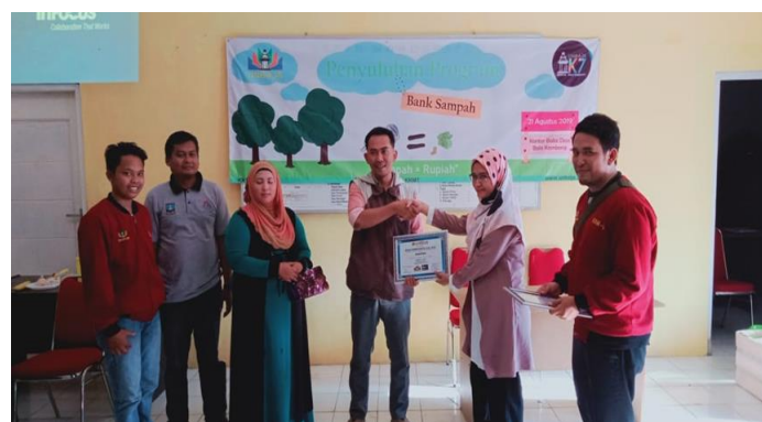
Gambar 5. Pemberian sertifikat kepada nara sumber.