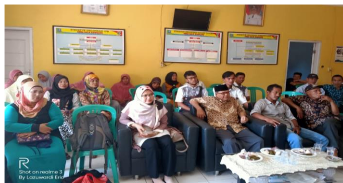
Gambar 2. Pelaksanaan Pelatihan di Aula Desa Bale Kambang.