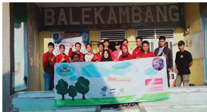
Gambar 1. Persiapan Pelaksanaan Pengabdian di Aula Desa Bale Kambang

Pemberian materi mengenai proses pembuatan kompos dengan menggunakan metode Takakura dan cara pembuatannya, pengenalan nama-nama bahan yang digunakan. Kegiatan selanjutnya yaitu pelaksanaan KKN-PPM di Desa Bale Kambang kec. Mancak. Kegiatan selanjutnya adalah pelaksanaan KKM-PPM di Desa Bale Kambang dengan tema 'Sampah = Rupiah'. Kegiatan dilaksanakan pada hari Rabu Tanggal 21 Agustus 2019.