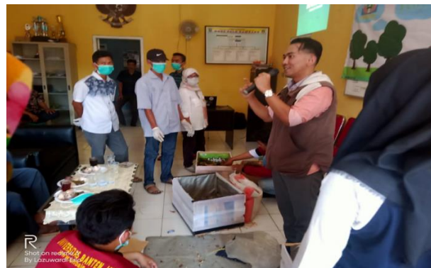
Gambar 4. Pelaksanaan Praktek Pembuatan Kompos dengan Metode Takakura.