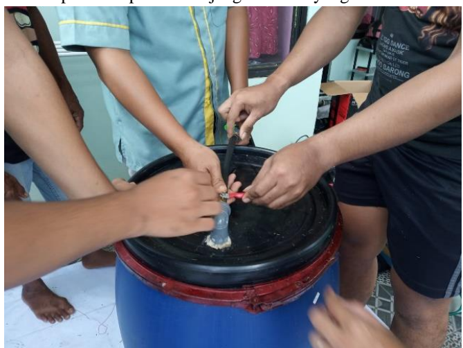
Gambar 3. Pembuatan Modifikasi Silo

Pengawetan pakan dilakukan untuk penyimpanan atau stok pakan untuk menjaga apabila ketersediaan pakan segar habis. Metode pengawetan pakan terdiri dari 2 jenis secara umum yang dikenal dengan metode pengawetan secara kering atau disebut dengan metode hay dan metode pengawetan secara basah atau disebut dengan metode silase. Metode hay dilakukan dengan memanfaatkan sinar matahari (penjemuran) atau dapat diangin-anginkan, namun dengan syarat tempat dijadikan untuk pembuatan hay tidak lembab sehingga proses pengeringan dapat berjalan dengan baik. Sedangkan metode pengawetan silase dilakukan dengan memanfaatkan bakteri untuk mendegradasi pakan agar dapat memperbaiki kualitas pakan, serta dapat disimpan dalam jangka waktu yang lama.