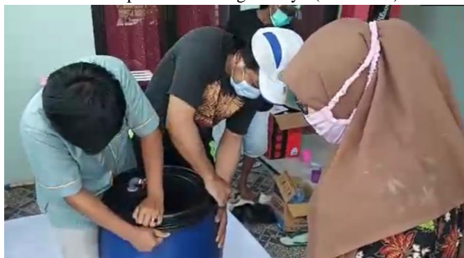
Gambar 2. Proses Pembuatan Silase

pengawetan pakan berbahan dasar pakan yang tersedia di Kawasan Kelompok Ternak Bago Mulyo (Gambar 2).