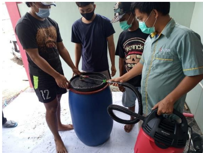
Gambar 4. Proses Vakum menggunakan Silo Modifikasi

Sebelumnya dijelaskan terlebih dahulu mengenai silo yang telah dimodifikasi serta manfaatnya untuk dijadikan dan diterapkan dalam pembuatan silase. Silo yang dimodifikasi merupakan silo yang diberikan tambahan komponen untuk meminimalisir adanya oksigen didalam silo saat proses fermentasi (Gambar 4).