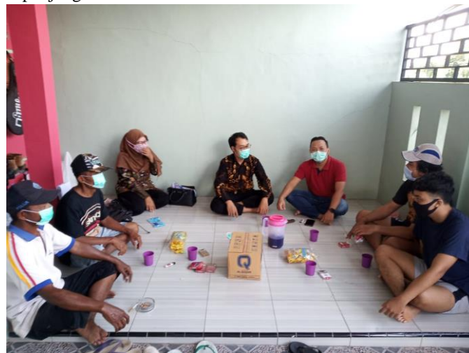
Gambar 1. Sosialisasi Pentingnya Penerapan Pengawetan Pakan

Adanya antusiasme dari peternak yang hadir menjadi Langkah awal untuk menerapkan teknologi yang telah dibuat oleh tim pengabdian. Hal ini dapat membantu dalam proses interpretasi dan penerapan teknologi khususnya teknologi pengawetan pakan yang dapat menjaga ketersediaan pakan di sepanjang tahun.