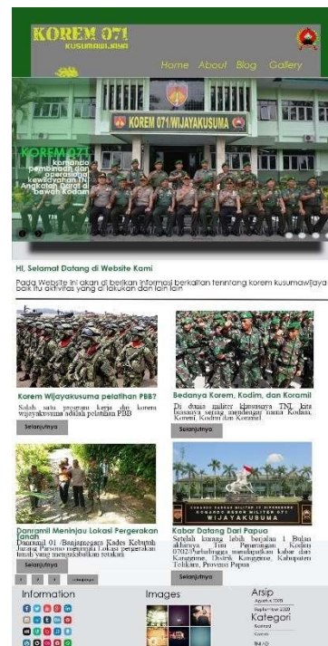
Gambar 5. Hasil desain grafis berupa banner dan desain website menggunakan adobe photoshop

Setelah melakukan pelatihan para peserta melakukan presensi dan mengisi kuisioner yang telah di beri oleh pemateri pada hari pelaksanaan pelatihan desain grafis selama dua hari