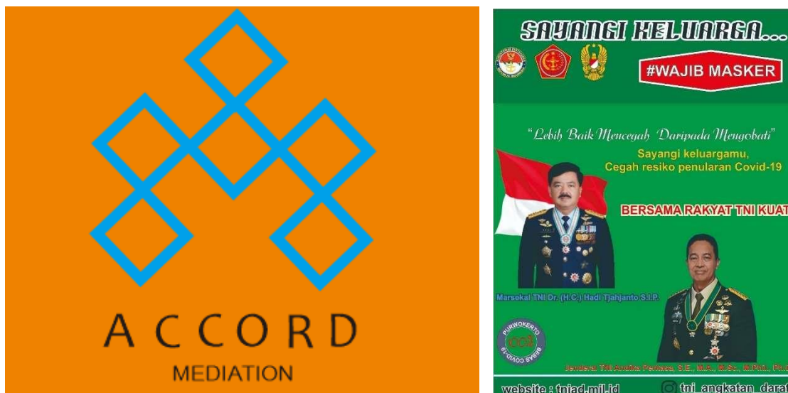
Gambar 3. Hasil desain grafis berupa logo dan poster menggunakan aplikasi Coreldraw

Pada gambar 2, peserta dilatih dengan membuat bermacam desain seperti logo dan poster. Para peserta memiliki kemauan untuk memahami pembuatan logo dan poster sebagai bekal ketrampilan yang cukup mudah untuk di pelajari dan di praktekkan