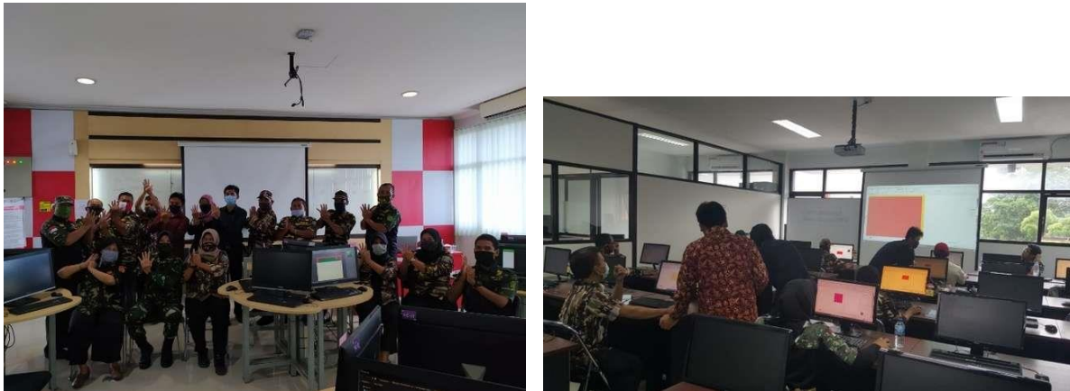
Gambar 2. Pelatihan CorelDraw Hari Pertama

Pada gambar 2, peserta dilatih dengan membuat bermacam desain seperti logo dan poster. Para peserta memiliki kemauan untuk memahami pembuatan logo dan poster sebagai bekal ketrampilan yang cukup mudah untuk di pelajari dan di praktekkan