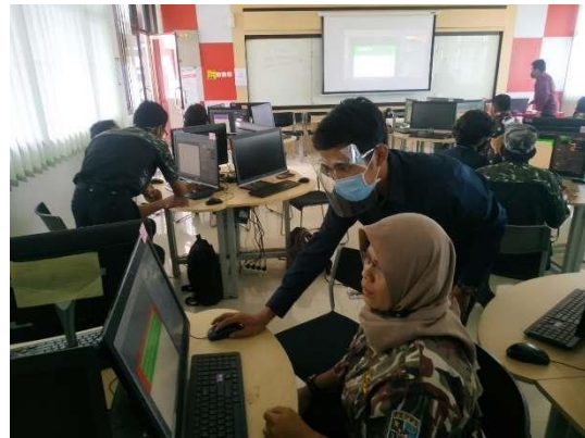
Gambar 4. Pelatihan hari kedua desain grafis menggunakan adobe photoshop

Pada peserta mengerjakan pelatihan desain grafis dengan sungguh-sungguh sehingga para peserta bisa membuat banner dan desain website dengan baik dan benar