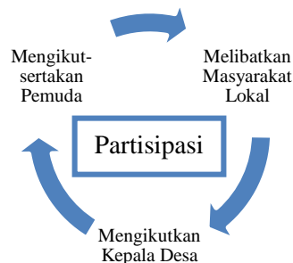
Gambar 4.1 Pendekatan Partisipatif

Upaya-upaya yang dilakukan pengelola desa wisata untuk menstimulasi kesadaran semua unsur kalangan masyarakat tentang pentingnya support dari mereka dalam proses pengembangan pariwisata halal yang berkelanjutan di Desa Setanggor.