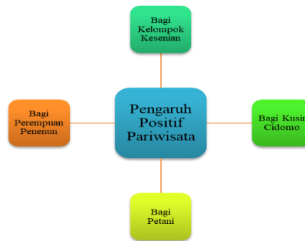
Gambar 4.3 Pengaruh Positif Pariwisata

Dalam konteks Setanggor, kehadiran industri pariwisata dapat memberikan manfaat secara ekonomi dan terjaganya ketahanan sosial-budaya masyarakat lokal serta mengurangi dampak negatif terhadap lingkungan. Oleh karena itu, antusiasme masyarakat yang tinggi dalam melihat sektor pariwisata bisa menjadi modal yang sangat berharga dalam membenahi dan membangun destinasi wisata yang memiliki peluang ekonomis bagi masyarakat lokal.