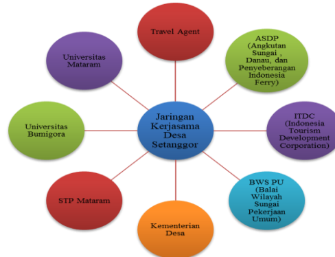
Gambar 4.5 Kerjasama Desa Setanggor

dengan konsep pentahelix (pemerintah, swasta, media, akademisi, dan komunitas). Menjalin mitra dengan pihak perguruan tinggi (akademik), pemerintah setempat dan komunitas-komunitas lainnya sebagai upaya untuk meningkatkan kapasitas SDM dalam mengembangkan pariwisata halal Desa Setanggor.