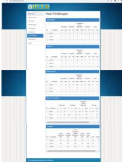
Gambar 3.7 Halaman Hasil Perhitungan

Pada halaman ini akan menampilkan hasil dari perhitungan menggunakan metode profile matching serta menampilkan hasil akhir berupa perankingan dari pengujianya.