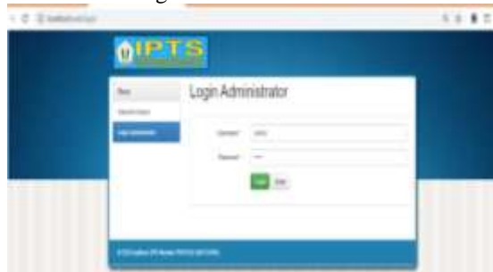
Gambar 3.2 Tampilan Halaman Login

Pada halaman ini menampilkan halaman login yang mana admin memasukkan username dan password untuk melakukan login.