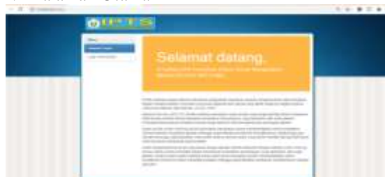
Gambar 3.1 Halaman Utama

Pada halaman ini menampilkan informasi tentang metode profile matching dan menampilkan beberapa menu seperti menu halaman depan dan halaman login.