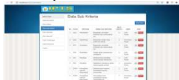
Gambar 3.5 Halaman Input Sub Kriteria

Pada halaman ini akan menampilkan data subkriteria dimana subkriteria ini bagian dari kriteria yang telah diinputkan pada halaman kriteria dan pada halaman ini juga bisa melakukan penambahan data subkriteria sesuai kebutuhan.