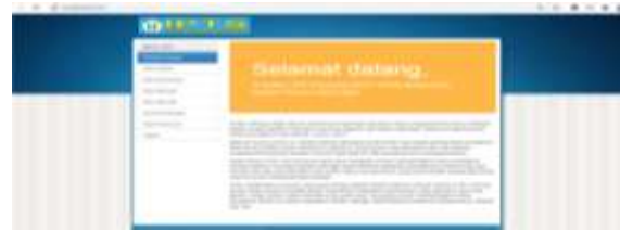
Gambar 3.3 Halaman Utama Admin

Pada halaman ini akan menampilkan menu menu yang berfungsi sesuai kebutuhan admin dalam melakukan proses pengolahan data menggunakan metode Profile Matching .