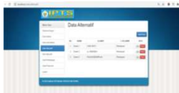
Gambar 3.6 Halaman Data Alternatif

Pada halaman ini menampilkan data alternatif. Di mana data alternatif merupakan data dosen yang akan di uji dan bisa pada halaman ini bisa melakukan penambahan data alternatif sesuai kebutuhan.