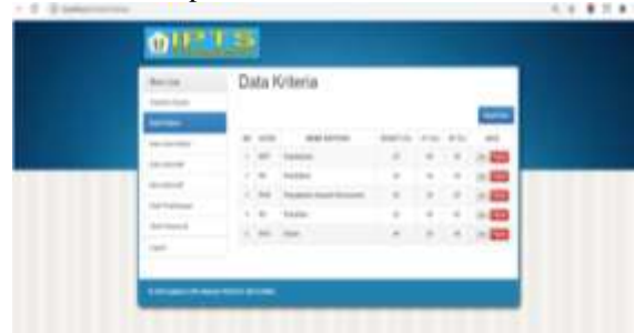
Gambar 3.4 Halaman Input Kriteria

Pada halaman ini akan menampilkan data kriteria yang telah ditentukan dan bisa melakukan penginputan data kriteria sesuai kebutuhan.