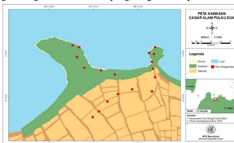
Gambar 1. Peta Kawasan Cagar Alam Pulau Dua

Penelitian ini dilakukan pada tanggal 4 – 6 Mei 2018 di CA Pulau Dua yang secara administratif terletak di Desa Sawah Luhur, Kecamatan Kasemen, Provinsi Banten. Secara geografis CA Pulau Dua berada pada 106°11'38" - 106°13'14" BT dan 6°11'5" - 6°12'5" LS. Metode yang digunakan, yaitu metode Point Transect dengan pengambilan data jenis dan individu burung menggunakan metode IPA ( Index Point of Abundance ). Pengamatan dilakukan pada pagi hari pukul 06.00-08.00 WIB dan sore hari pukul 15.00-17.00 WIB dengan asumsi burung mulai aktif melakukan aktivitas pada rentang waktu tersebut. Masing-masing lokasi dilakukan pengulangan sebanyak 3 kali.