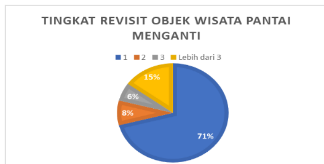
Gambar 1 1 Tingkat Revisit Objek Wisata Pantai Menganti