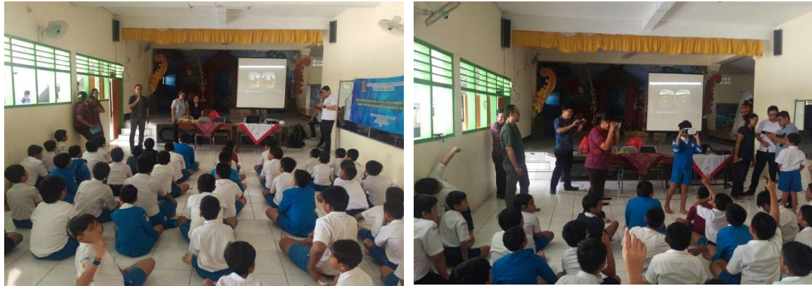
Gambar 3.2 Proses pelatihan dan pendampingan