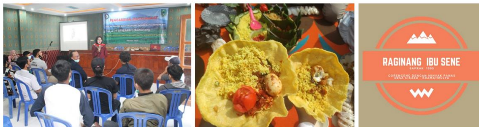
Gambar 4. Pendampingan Desain Kreatif Produk

Dibutuhkannya labeling produk sebagai wujud antusias pemuda karangtaruna dalam memajukan produk UMKM lokal. Pengemasan menarik dapat menumbuhkan perasaan kepada wisatawan untuk membeli produk Cikaso Creative sebagai oleh-oleh. Selama ini pengemasan produk yang dihasilkan pelaku UMKM masih tergolong sederhana. Hal tersebut dikarenakan minimnya pengetahuan dan terbatasnya daya kreatifitas pelaku usaha. Hasil pendampingan dalam kreatif desain tahap 3 yaitu melihat daftar list yang telah diidentifikasi produk UMKM di Cikaso, selanjutnya mencari ide kreatif dalam mendesain produk, dan satu ide kreatif muncul dari terinspirasi opak/kerupuk yang dijual terpisah sebenarnya dapat disajikan untuk alat makanan dan sebagai kreatif penyajian produk kuliner. Selanjutnya menemukan beberapa produk unggulan Cikaso dan membuat program desaint produknya secara langsung yang dibantu oleh karang taruna dalam pembuatan labelling produk. Aplikasi yang digunakan dalam labelling ini dengan pendampingan melalui program photoshop dan program aplikasi antroid yang mudah dan cepat. Adapun kegiatan pendampingan desain produk seperti gambar 4 berikut.