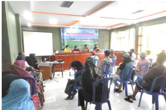
Gambar 2. Identifikasi Ekonomi Kreatif pada UMKM masyarakat Cikaso bersama karang taruna

Tahapan pertama PKM STIEPARI Semarang bersama Kadis Cikaso dengan mengumpulkan pelaku UMKM dan Karang Taruna yang akan diberikan pendampingan secara mendalam mengenai ekonomi kreatif. Mengidentifikasi jenis usaha yang dimiliki melalui Fokus Group Discussion , diberikan wawasan dan pelatihan dalam pengemasan produk, sehingga memiliki nilai tambah. Dengan harapan peluang usaha yang ada dapat ikut berperan dan siap menjadi produk pelengkap dalam pengembangan rintisan desa wisata. Identifikasi Ekonomi Kreatif pada UMKM masyarakat Cikaso seperti pada gambar 2 berikut.