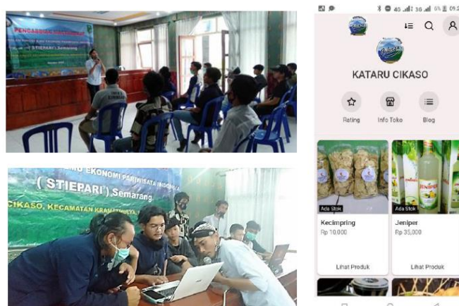
Gambar 3. Pendampingan Kreatif E-Commerce

Tahapan ketiga dilakukannya kegiatan penyuluhan, pelatihan dan pendampingan. Pemuda karang taruna. dikumpulkan untuk diberikan wawasan dan pendampingan mengenai design kreatif dalam pengemasan produk. Dari 25 peserta karangtaruna, ternyata masih banyak yang belum bisa hadir dan berperan. Hal tersebut dikarenakan selama ini tidak mendapatkan ruang untuk mereka berperan dalam pengembangan wisata. Dengan adanya upaya pelatihan desain kreatif untuk pembuatan toko online diharapkan pemuda karangtaruna dapat berperan membantu pelaku UMKM dalam pembuatan pengemasan produk. Teknologi mudah menjangkau pasar dan lebih cepat menjangkau konsumen, sehingga e-commerce sangat diminati oleh pembisnis, salah satu strategi Tim adalah karang taruna dapat berkontribusi kepada UMKM lokal dalam memasarkan produknya melalui toko online yang berbasis startup di android yang tentunya pasti dimiliki oleh pelaku UMKM baik dirinya sendiri ataupun keluarganya. Sehingga peran aktif toko online ini sangat mudah. Kegiatan pada tahap ketiga ini sebagaimana gambar 3 berikut.