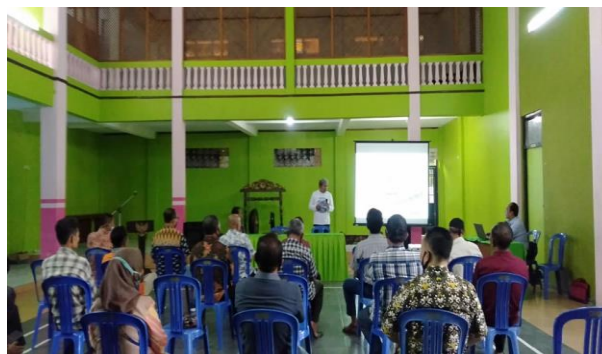
Gambar 1. Sosialisasi Penguatan Kelembagaan Pokdarwis