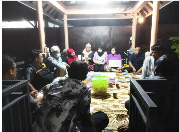
Gambar 3. FGD dan Simulasi Penyusunan Visi dan Misi

Kegiatan perumusan visi dan misi ini diikuti oleh 10 orang pengurus Pokdarwis. Cara menyusun visi misi diawali dengan menjaring harapan dan impian dari masing-masing anggota pokdarwis terhadap arah organisasi ini ke depan. Gambar 3. Merupakan dokumentasi FGD proses penyusunan Visi dan Misi Organisasi