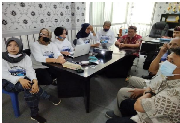
Gambar 2. FGD Penciptaan Nama dan Logo Pokdarwis

Kegiatan pengabdian kemudian dilanjutkan dengan diskusi dengan pengurus Pokdarwis, tim pengabdian dan tim dinas pariwisata Kabupaten Kuningan untuk membantu penciptaan Identitas Kelembagaan Pokdarwis. Gambar 2. Menunjukkan kegiatan FGD ini dilakukan untuk menampung aspirasi pengurus dalam menetapkan sebuah nama untuk pokdarwis berdasarkan sejarah, ciri khas kondisi desa, serta membantu pembuatan desain logo yang mencerminkan nama, nilai dan semangat pokdarwis tersebut. FGD menghasilkan 9 usulan nama dan akhirnya disepakati 1 nama sebagai nama pokdarwis.