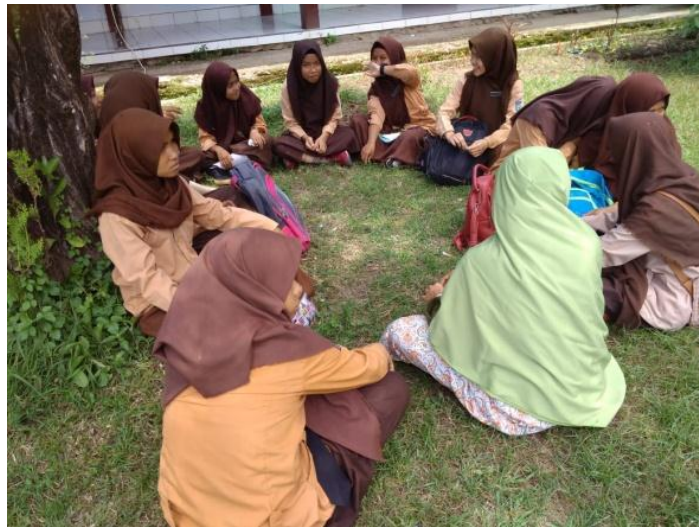
Gambar 1. Pelaksanaan Pendampingan dan Pembimbingan Pada Kelompok I di Halaman Sekolah

awal pertemuan siswa harus dipaksa dulu, namun setelah beberapa kali pertemuan, sebagian dari mereka sudah menyadari betapa pentingnya kegiatan tersebut.