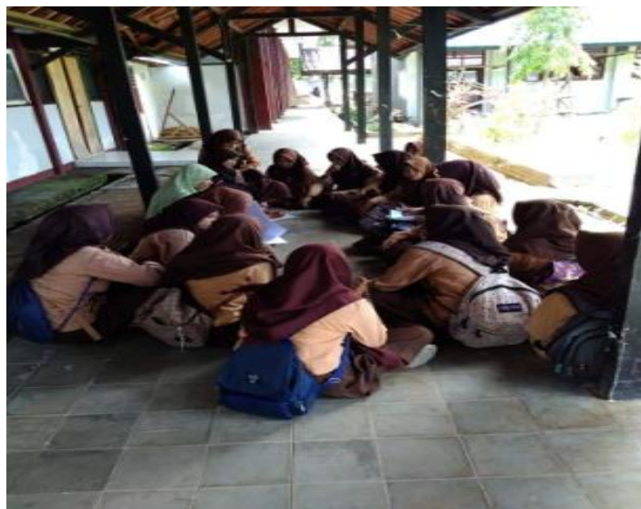
Gambar 2. Pelaksanaan Pendampingan dan Pembimbingan Pada Kelompok II di Lorong Depan Kelas