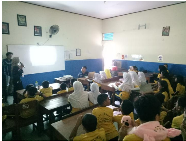
Gambar 1. Suasana Penyampaian Materi Dampak Gawai

dilakukan ice breaking berupa games . Tujuan diadakan games selain sebagai hiburan juga untuk menstimulus anak tentang ide kegiatan yang dapat dilakukan sebagai pengganti bermain gawai. Adapun suasana penyampaian materi terlihat pada Gambar 1 berikut.