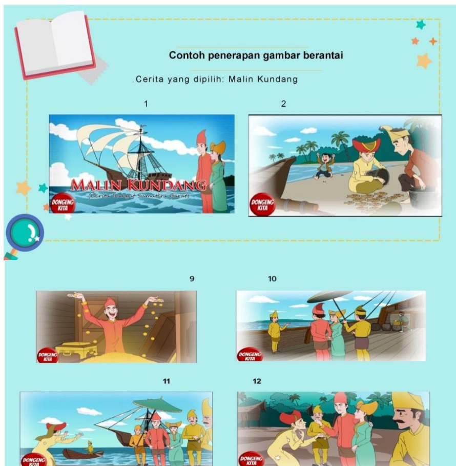
Gambar 2. Penerapan Metode Gambar Berantai

Setelah dilakukan pembekalan materi cerita rakyat, dilakukan penerapan metode gambar berantai dalam pengenalan cerita rakyat. Hal