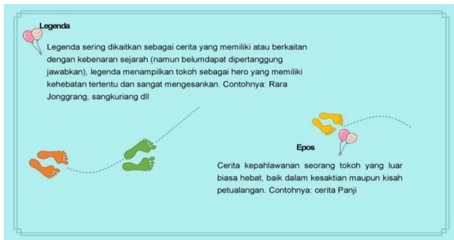
Gambar 1. Pengenalan Cerita Rakyat

Kegiatan ini disampaikan oleh Dewi Yanti, M.Pd dosen Sastra Indonesia Universitas Pamulang. Kegiatan ini dilakukan agar para peserta memahami persoalan cerita rakyat. Pada kegiatan ini disampaikan materi tentang cerita rakyat, fungsi cerita rakyat, eksistensi cerita rakyat serta permasalahan dalam cerita rakyat saat ini.