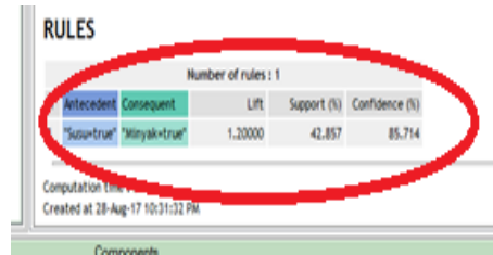
Gambar 2. Pengujian dengan Rules dari pola kombinasi Itemsets

Untuk membuktikan data-data yang telah dihasilkan berupa pola hubungan kombinasi antar items dan rules-rules asosiasi sesuai dengan Algoritma Apriori maka perlu dilakukan pengujian dengan menggunakan suatu aplikasi. Aplikasi yang digunakan adalah Tanagra versi 1.4 , dengan hasil rule dapat kita lihat pada gambar 2.