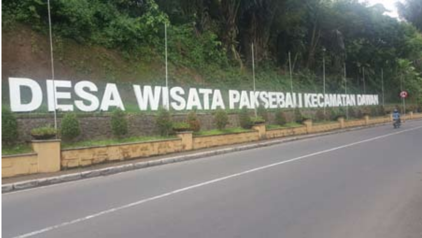
Foto 1. Wajah depan memasuki desa wisata Desa Wisata Pakseballi

model pengembangan desa wisata ini menuju Smart Eco-Tourism Village . Sebelum analisis, berikut disampaikan gambaran umum pariwisata Klungkung dan Dewa Wisata Pasekbali di antara desa wisata lainnya di daerah ini.