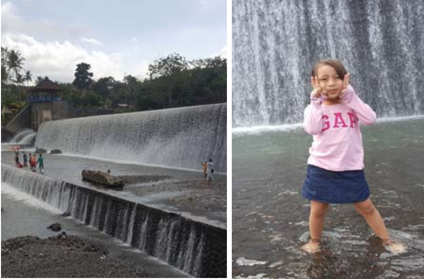
Foto 3. “Tirai air “ Kali Unda sebagai Venue foto pra wedding dan selfie

(c) Taman Seganing, merupakan tempat air suci abadi (tirta) oleh umat hindu atau masyarakat umum dipakai tempat untuk menyucikan diri atau sebagai wisata spiritual.