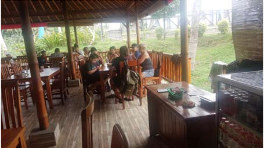
Foto 4. Suasana Restoran, para wisatawan menikmati makanan dan minuman setelah kegiatan rafting

3) Price . Harga Produk desa wisata Pakseballi sebagai berikut (a) Harga Paket tour: masih sedang perancangan karena pengelola belum siap untuk menjalankan; (b) Harga Penyewaan lokasi Prawedding Rp.750.000,00 dengan fasilitas anak-anak sebagai figuran pendukung; (c) Harga tiket masuk daya tarik wisata Sungai Unda Rp.10.000,00; (d) Harga Makanan dan minuman di restoran Sungai Unda untuk paket Prasmanan ( buffet ) yang disediakan bagi peserta rafting sebesar Rp. 45.000,00/pax dan menu alacarte dibagi dalam kategori, yaitu kode I = Internasional, Kode D = Dometik, Kode L = Lokal