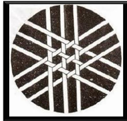
Gambar 5. Unsur Matematika pada Pola Anyaman.

Anyaman ini termasuk ke dalam anyaman tiga sumbu. Khusus untuk anyaman tiga sumbu rapat, apabila dibentuk dengan pola bentuk heksagonal/segi enam beraturan disebut dengan anyaman segi enam.