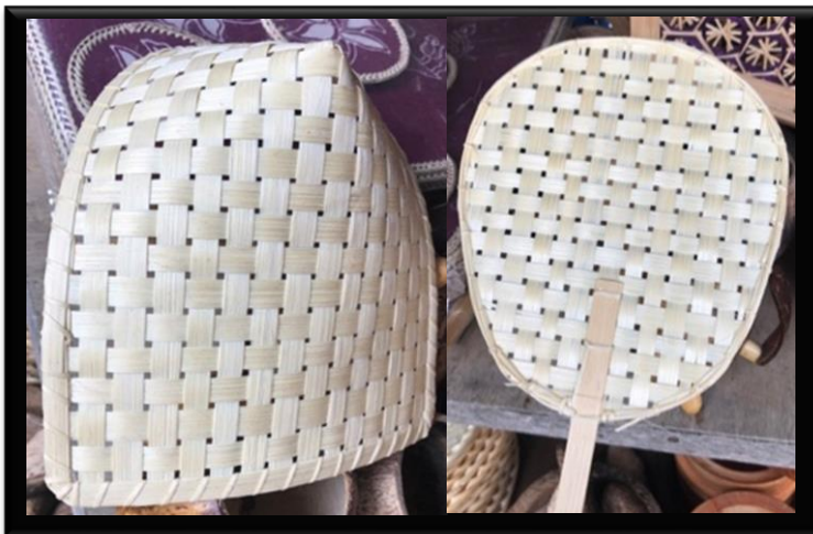
Gambar 2. Tengkor dan Kipas.

diantaranya tengkor dan kipas. Tengkor atau pincuk anyaman bambu merupakan peralatan rumah tangga yang digunakan masyarakat kampung naga untuk alas makanan seperti lotek dan pecel.