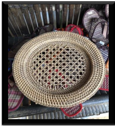
Gambar 4. Piring alas makan.

Beberapa unsur matematika yang ada dalam pola anyaman tersebut diantaranya: bangun geometri persegi, antara persegi yang satu dengan yang lainnya simetris, sudut-sudut yang dibentuk adalah sudut siku-siku, garis horizontal tegak lurus dengan garis vertikal, antara garis horizontal yang satu dan yang lain saling sejajar, begitu pula antara garis vertical yang satu dengan yang lainnya saling sejajar. Kerajinan anyaman lainnya diantaranya: piring alas buat makan.