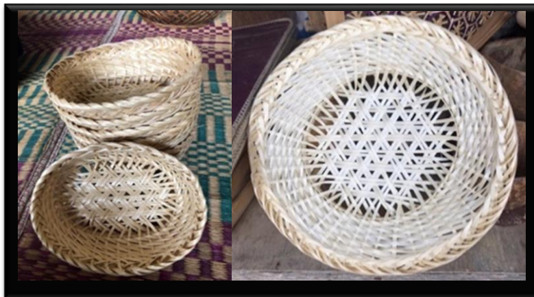
Gambar 6. Piring Snek.

Bangun geometri yang terdapat dalam kerajinan masyarakat kampung naga tersebut digolongkan pada A Demi Regular Tessellation . Anyaman piring snek berbentuk bangun geometri elips dan rigen piring membentuk bangun geometri lingkaran. Anyaman ini termasuk ke dalam anyaman empat sumbu. Teknik dasar anyaman empat sumbu termasuk teknik dasar anyaman yang mempunyai lubang dengan bentuk orthogonal/segi delapan beraturan. Nama lain dari teknik dasar anyaman empat sumbu adalah teknik dasar anyaman segi delapan karena mempunyai lubang dengan bentuk segi delapan beraturan.