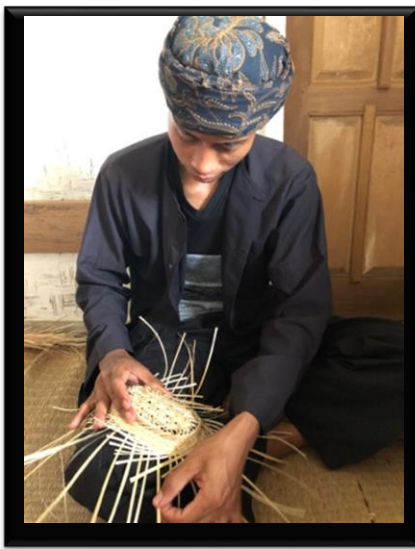
Gambar 1. Menganyam.

Masyarakat kampung naga, di sela-sela kesibukannya sebagai petani mereka mengisi waktu luangnya untuk membuat kerajinan berupa anyaman yang berasal dari bambu. Berbagai jenis kerajinan mereka buat dengan cara yang mereka pelajari secara turun temurun.