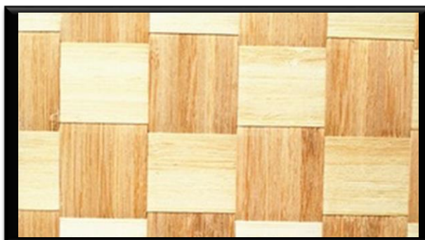
Gambar 3. Unsur Matematika pada Pola Anyaman.

anyaman bilik. Hasil dari teknik dasar anyaman ini adalah anyaman tiga sumbu jarang dan anyaman tiga sumbu rapat. Sumbu jarang memberikan lubang yang renggang dan sumbu rapat akan memberikan kekuatan yang lebih kuat.