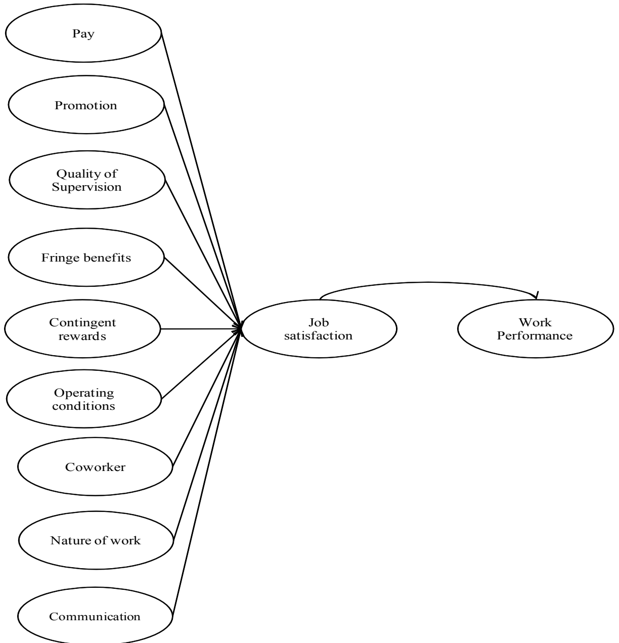
Gambar 3.1 Kerangka Konseptual Penelitian

Dari uraian pada latar belakang tentang penelitian terdahulu, dibangun sebuah model penelitian dimana job satisfaction dipengaruhi oleh pay , promotion , Supervision , Fringe benefit , Contingent rewards , Operating conditions , Coworkers , Nature of work , dan Communication sedangkan work performance dipengaruhi oleh job satisfaction . (Spector, 1997)