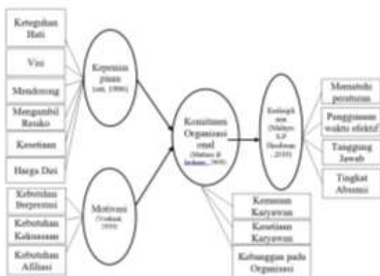
Gambar 1 Model Penelitian

Berdasarkan uraian tersebut maka dibuat gambar model di bawah ini: