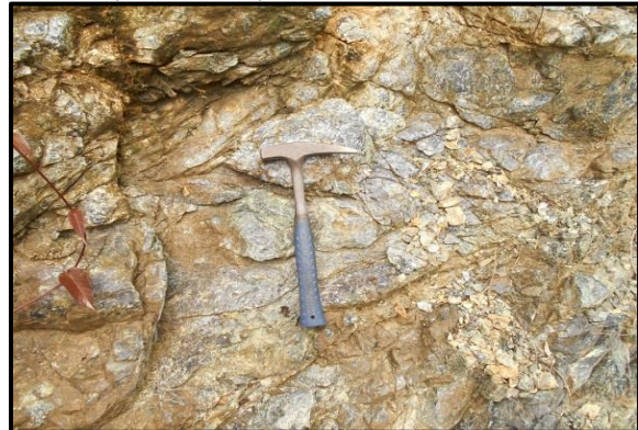
Gambar 4. Singkapan batuan serpentinit di hulu Ake Wel wale besbi sele (17/HT/0279AR)

batuan ini tersingkap pada lereng-lereng sungai di bagian hulu yang berlereng terjal, seperti yang tersingkap di hulu Ake Welwalebesbisele pada lokasi 17/HT/0279A (Gambar 4), sedangkan yang tersingkap di hulu Ake Meno dekat dengan lokasi 17/HT/0286 CD terlihat menunjukkan gejala pelapukan dan oksidasi, (Gambar 6). Satuan batuan ini secara regional dapat dikorelasikan dengan Kompleks Batuan Ultrabasa berumur Pra Kapur (T. Apandi dkk, 1980). Pengamatan float batuan di lingkungan batuan ultrabasa menunjukkan adanya indikasi berupa kehadiran mineral garnierit dalam float , seperti yang ditemukan di hilir Ake Welwalebesbisele dan Ake Wosia (Gambar 5).