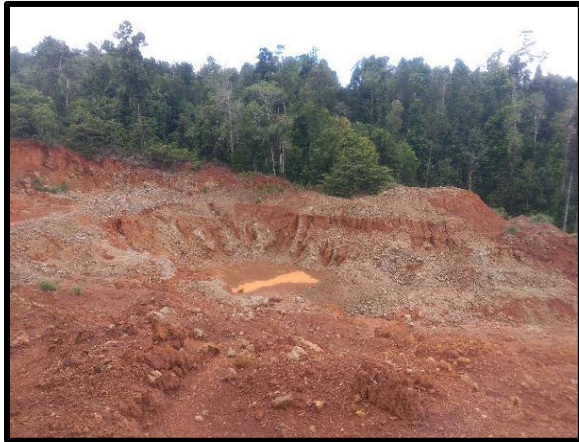
Gambar 7. Endapan nikel laterit

Secara regional mineralisasi di Weda, Kabupaten Halmahera Tengah adalah mineralisasi nikel laterit. Mineralisasi yang terjadi dalam batuan ultrabasa ditunjukkan oleh adanya mineral garnierit seperti yang ditemukan di sebelah utara Lelilef, Sungai Wasia dan di sebelah barat Gunung Limber dan didukung dengan hasil analisis geokimia ada 5 daerah anomali dengan kandungan (4672ppm – 9600 ppm) terletak pada kawasan kompleks batuan ultrabasa (Lampiran peta).