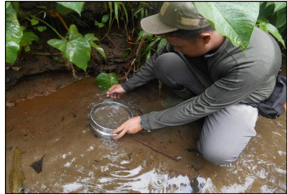
Gambar 1. Pengambilan contoh sedimen sungai menggunakan saringan 80 #

Conto endapan sungai ini diambil di daerah Weda berasal dari sungai Ake Fidi, sumber dari percabangan anak-anak sungai intermiten Ake Goro. Karakteristik morfografi pada daerah ini dicirikan oleh bentuk lahan perbukitan bergelombang dengan ketinggian 50-550 mdpl dan sungai-sungai membentuk pola rektangular. Lokasi pengambilan conto endapan sungai berada di areal perkebunan dan hutan