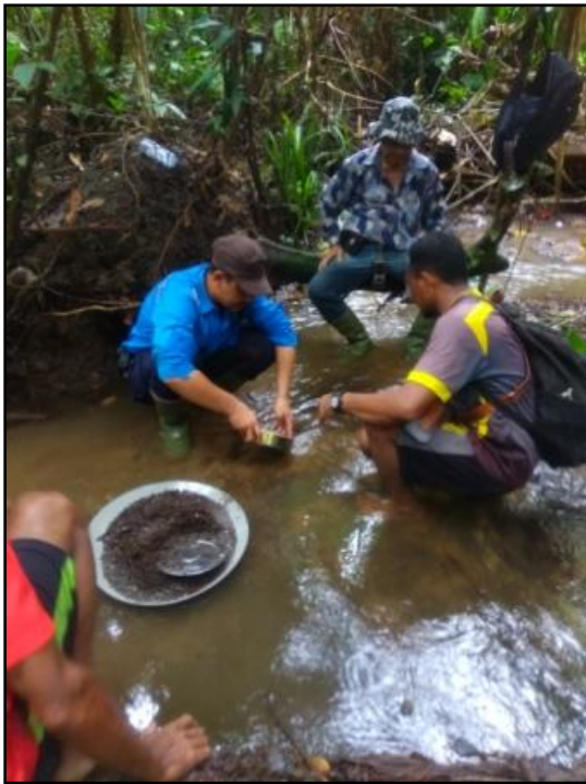
Gambar 3. Pengambilan contoh geokimia sedimen sungai menggunakan saringan 80 #

Contoh endapan sungai ini diambil di daerah Kobe dan sekitar desa Sepo dari sungai Ake Walwalebesbisele. Karakteristik morfografi pada daerah ini merupakan bentuk lahan Perbukitan Terjal dengan ketinggian 250-1250 mdpl dan sungai-sungai membentuk pola trellis dikontrol oleh struktur. Lokasi pengambilan contoh endapan sungai berada cukup jauh dari pemukiman dan berada di areal Hutan Lindung.