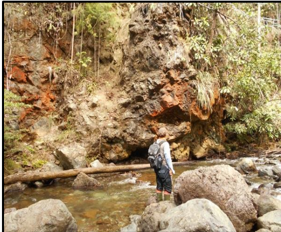
Gambar 6. Singkapan batuan ultrabasa menunjukkan oksidasi pelapukan di hulu Ake Ake Meno.