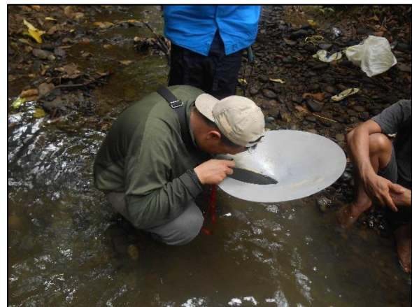
Gambar 2. Pendulungan dan pengamatan mineral berat