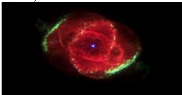
Gambar-2 : Kumpulan Galaksi Seperti Bunga Mawar Merah

Maka nikmat Tuhanmu yang manakah yang kamu dustakan? (Departemen Agama RI,2005)