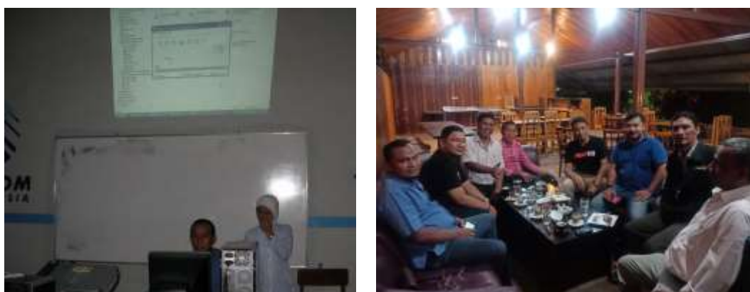
Gambar 2. Kegiatan Pelaksanaan Pelatihan dan Rapat Gampong

Selama 2 hari tersebut, pada hari pertama peserta yaitu para guru SD N 19 Kota Sabang telah berhasil mempraktikkan materi internet yaitu Browsing, Searching, Downloading, dan mengelola akun E-mail. Pada hari kedua, peserta juga telah berhasil mempraktikkan materi Powerpoint dengan membuat tulisan, membuat rancangan tampilan, mengatur animasi tampilan untuk presentasi. Melihat dari pentingnya fungsi dari penggunaan internet dan Powerpoint untuk pengembangan sekolah, maka sekolah yang telah memiliki jaringan komputer ke internet perlu diadakan pelatihan seperti ini, sehingga pemanfaatan fasilitas yang sudah tersedia disekolah tersebut dapat dimanfaatkan semaksimal mungkin untuk mendukung kualitas SDM maupun kualitas PBM disekolah tersebut.