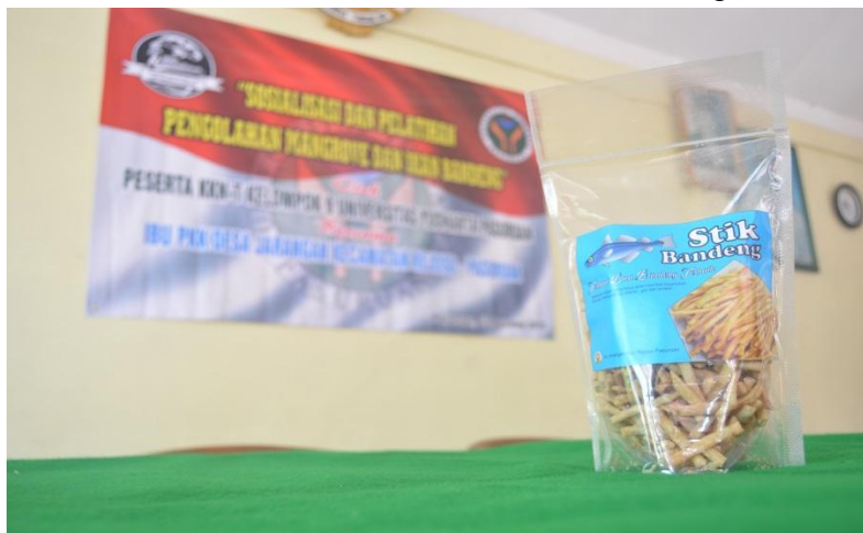
Gambar 5. Stik Ikan Bandeng