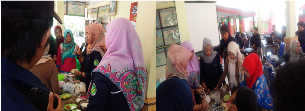
Gambar 3. Penyuluhan dan Praktek Pembuatan Stik dan Es Krim Ikan Bandeng

Materi pelatihan meliputi proses pemisahan ikan bandeng dari daging dan durinya, pembuatan stik dan es krim ikan bandeng, cara pengemasan, cara penggunaan alat-alat produksi, cara menghitung keuangan dan penentuan harga serta cara pemasaran lewat on line . Evaluasi dilakukan dalam bentuk pertanyaan kontrol yang bertujuan untuk melihat perhatian dan minat dari peserta pelatihan ini. Hal-hal yang menjadi faktor pendukung dalam kegiatan ini adalah :