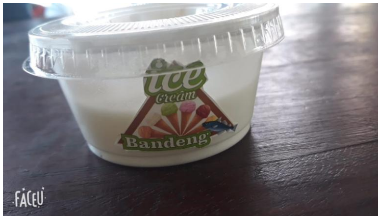
Gambar 4. Es Krim Ikan Bandeng

Hasil evaluasi kegiatan melalui kuisioner, kemudian dijadikan dasar untuk melakukan peninjauan selanjutnya. Kegiatan ini tidak hanya berhenti pada saat kegiatan pelatihan bersama tim saja. Keberlanjutan kegiatan dan pengawasan terhadap penggunaan alat yang diserahkan kepada warga dalam hal ini kelompok ibu-ibu PKK RT.5 dan RT.6 RW.2 Kelurahan Kidul Dalem Kodya Malang melalui Tim IbM Universitas Yudharta Pasuruan dan ada tidaknya transfer ilmu dalam pembuatan produk yang telah diberikan akan dilakukan secara berkala.