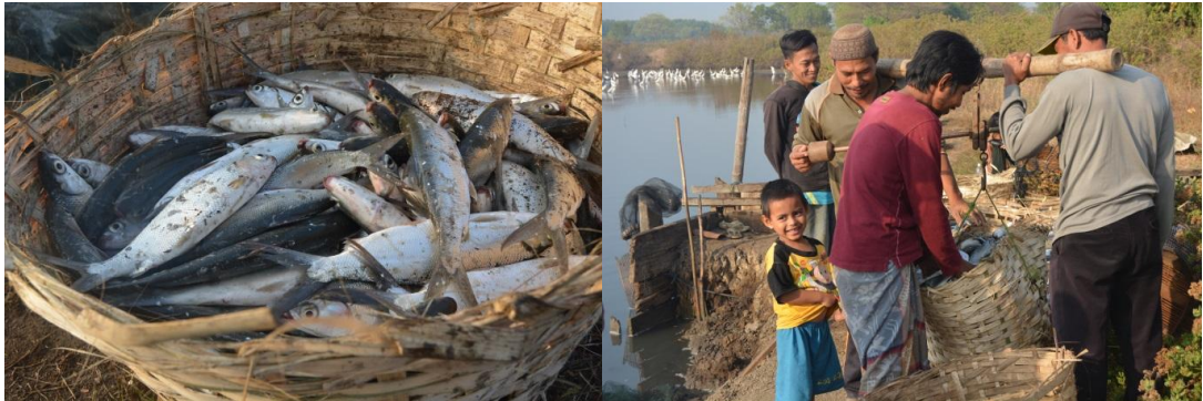
Gambar 2. Proses Pemanenan Ikan Bandeng

menarik minat konsumen khususnya yang tidak terlalu gemar makan ikan, bisa merasakan manfaat dari makan ikan sendiri tetapi disajikan dalam bentuk olahan yang menarik dan salah satunya dijadikan dalam bentuk stik dan es krim. Olahan es krim dari ikan bandeng sendiri diharapkan dapat menarik minat anak-anak yang memang kebanyakan kurang suka makan ikan menjadi gemar makan ikan dan tentunya sangat baik sekali untuk perkembangan otak mereka.