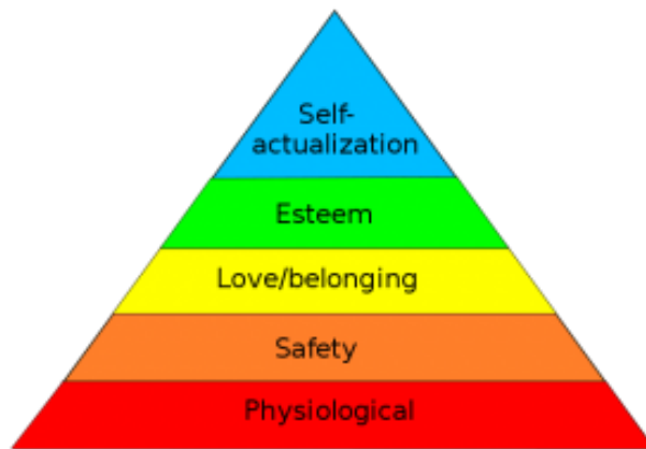
Gambar Piramida Kebutuhan Maslow