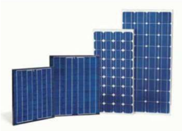
Gambar 3. Panel Surya (Sollar Cell)

Untuk kondisi penyinaran matahari di kampus UBT. dari nilai rata-rata intensitas matahari tersebut kita mencari nilai radiasi matahari dengan mengalikan nilai intensitas cahaya matahari. Pada perhitungan menggunakan nilai intensitas matahari terendah selama 9 jam yaitu sekitar jam 08:00 sampai 17:00.