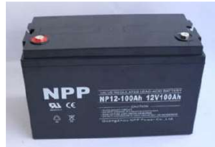
Gambar 4. Baterai

Untuk menentukan kapasitas baterai harus mengetahui total beban yang akan di tanggung. dalam hal ini total beban yang akan di tanggung adalah sebesar 64.272 Wh. Jadi untuk menentukan nilai kapasitas baterai yang akan digunakan sebagai cadangan daya adalah dengan membagikan beban total dengan tegangan kerja pada baterai, tingkat kekosongan baterai dan efisiensi total sistem PV.