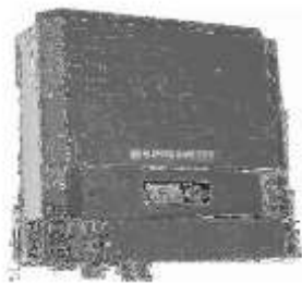
Gambar 6. Inverter

Spesifikasi inverter harus sesuai dengan tegangan kerja dari sistem dan tegangan pada beban AC. Berdasarkan tegangan sistem maka tegangan masuk dari inverter 48 VDC.