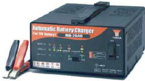
Gambar 5. Baterai Charger

Untuk menentukan besaran arus yang akan di gunakan adalah dengan menbagikan daya modul yang di gunakan dengan tegangan sistem.