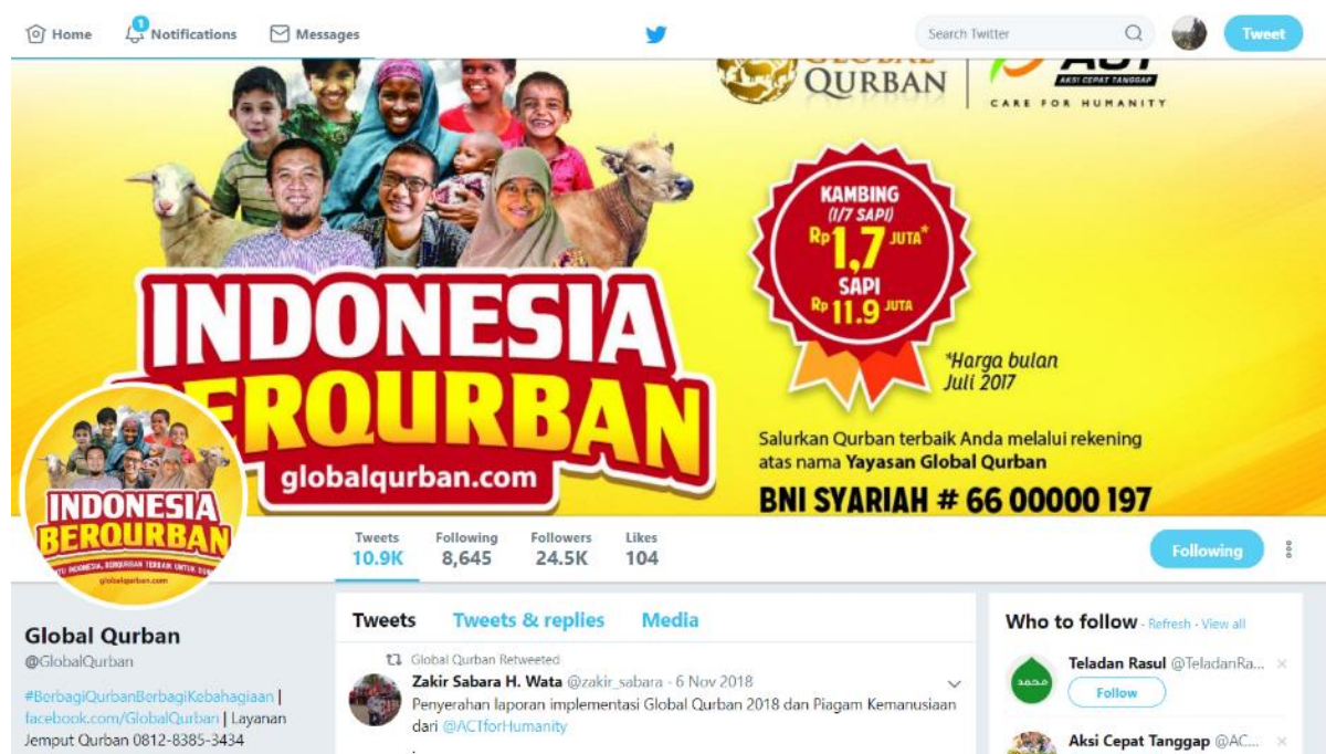
Gambar 3. Laman Akun Media Sosial Twitter Global Qurban Aksi Cepat Tanggap