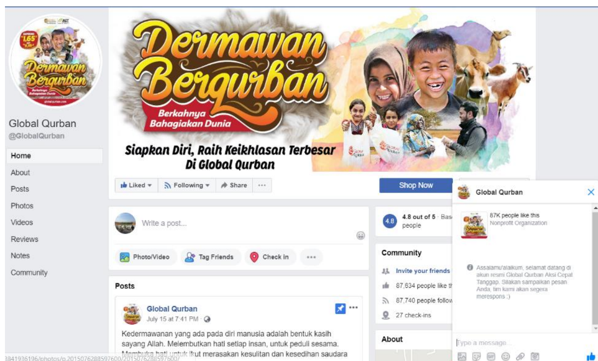
Gambar 1. Laman Akun Media Sosial Facebook Global Qurban Aksi Cepat Tanggap