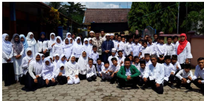
Gambar 1 Subjek Pengabdian SDN 5 Genteng Wetan

Pembimbing juga bertanggung jawab atas berlangsungnya pelatihan manasik haji, dengan mengadakan koordinasi pada panitia untuk bisa bekerjasama dalam mengkondisikan sarana prasarana yang berkaitan dengan pelatihan manasik haji tersebut. Maka pembimbing harus benar-benar fokus pada anak-anak dalam memberikan pelatihan agar pelatihan manasik haji yang diberikan pada anak-anak tersampaikan secara baik sesuai dengan apa yang telah direncanakan.