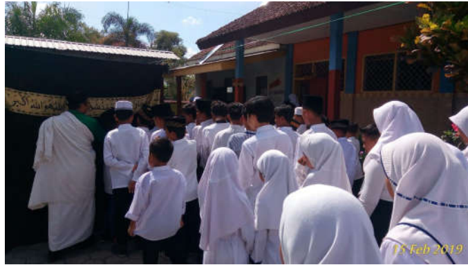
Gambar 6. Pelaksanaan Manasik Haji