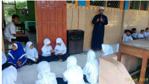
Gambar 4. Pembekalan Manasik haji oleh Narasumber