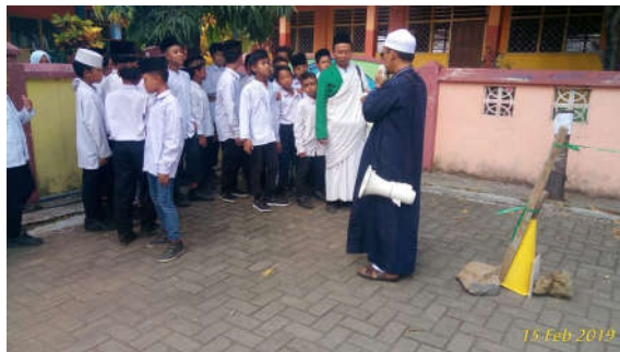
Gambar 3. Pelaksanaan Manasik haji di Luar Halaman Sekolah