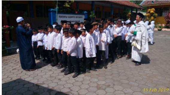
Gambar 2. Pelaksanaan Manasik Haji di Halaman Sekolah