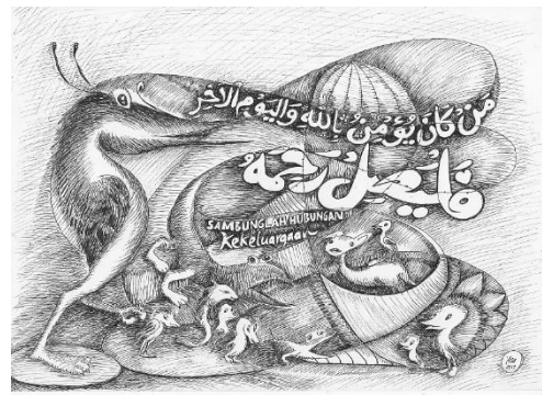
Gambar 4: Silaturrahmi

Pada gambar 3 adalah kutipan dari surah Al-Baqarah ayat 201 yang artinya adalah: ya Allah, Berikanlah kepada kami kebaikan di dunia, berikan pula kebaikan di akhirat dan lindungilah kami dari siksa neraka. (Q.S Al-Baqarah: 201) doa ini di syari'atkan untuk dibaca dalam semua kondisi, dan juga dalam kondisi-kondisi tertentu, doa ini dipanjatkan ketika thawaf dan berada di antara ar-Rukun al-Yamani dan al-Hajar al-Aswad (HR. Abu Dawud) dan juga ketika selesai menunaikan rangkaian Ibadah Haji serta ketika sedang ditimpa musibah