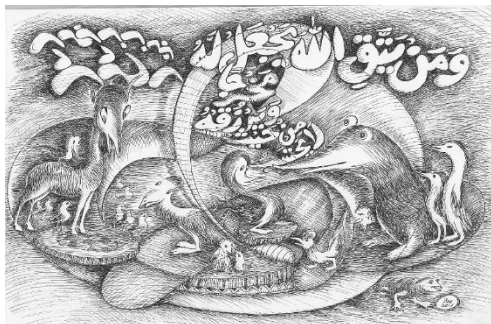
Gambar 2: QS. At-Thalaq: 2-3

Karya Kaligrafi pada Gambar 1 merupakan kalimat pembuka basmalah atau lengkapnya 'bismi-llahi ar-rahmani ar-rahimi' yang artinya 'dengan nama Allah Yang Maha Pemurah lagi Maha Penyayang' kalimat Basmalah merupakan kalimat yang tertera dalam setiap awalan surat di dalam Al-Quran, kecuali surat At-Taubah. Dalam agama Islam, basmalah juga diucapkan setiap kali hendak melakukan sholat dan juga diucapkan setiap melakukan kegiatan harian lainnya.