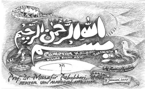
Gambar 1: Basmalah Dokumentasi: Abdul Aziz Ahmad, 2017

Karya Kaligrafi pada Gambar 1 merupakan kalimat pembuka basmalah atau lengkapnya 'bismi-llahi ar-rahmani ar-rahimi' yang artinya 'dengan nama Allah Yang Maha Pemurah lagi Maha Penyayang' kalimat Basmalah merupakan kalimat yang tertera dalam setiap awalan surat di dalam Al-Quran, kecuali surat At-Taubah. Dalam agama Islam, basmalah juga diucapkan setiap kali hendak melakukan sholat dan juga diucapkan setiap melakukan kegiatan harian lainnya.