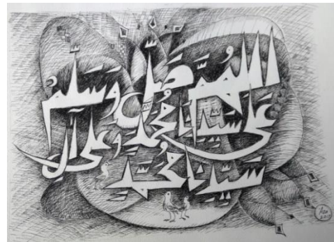
Gambar 7: Do'a Shalawat

Nabi Muhammad SAW yang wajib diucapkan ketika saat sholat yaitu pada tahiyat awal dan akhir.