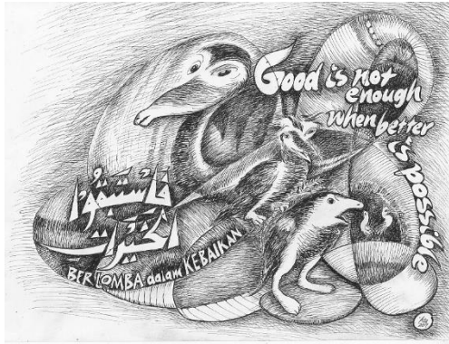
Gambar 5: Fastabiqul Khairat

Karya kaligrafi Islam pada gambar 4.5 merupakan ungkapan hikmah yang artinya adalah 'berlomba-lomba dalam kebaikan.' Maknanya adalah bahwa setiap manusia hendaknya berkewajiban dan senantiasa melakukan kebaikan kepada sesama manusia lainnya. Tidak hanya maju dalam kebaikan, tapi juga saling mendahului satu sama lain di dalam hal kebaikan. Dalam surah Al-Baqarah ayat 148 juga dijelaskan tentang berlomba-lomba dalam kebaikan tersebut yang artinya sebagai berikut: "Dan bagi setiap orang ada memiliki arah yang dituju ke arah mana dia menghadapkan wajahnya. Maka berlomba-lombalah kamu dalam berbuat kebaikan. Di mana saja kamu berada pasti Allah akan mengumpulkan kamu sekalian. Sesungguhnya Allah Maha Kuasa atas segala sesuatu." (QS. Al-Baqarah: 148) Sehubungan dengan kaligrafi latin yang ada pada gambar tersebut yaitu 'Good is not enough when better is possible' yang berarti 'baik saja tidak cukup ketika ada kemungkinan untuk lebih baik.'