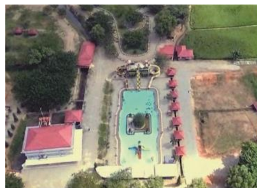
Gambar 3.3. Scene Preview Segmen 2