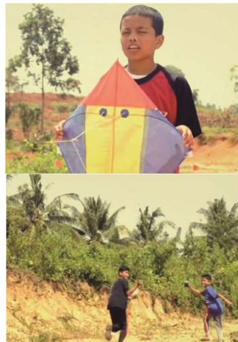
Gambar 3.2. Scene Preview Segmen 1