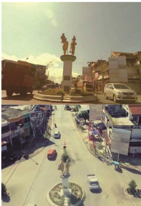
Gambar 3.1. Scene Pembukaan Video

Tempat/Lokasi berada di Tugu panen/tugu tani Kab. Sidrap. Kabupaten Sidenreng Rappang sering disingkat dengan nama Sidrap. Kabupaten Sidenreng rapping memiliki jam kota, orang biasa menyebutnya dengan tugu panen/tugu tani. Untuk mendatangi daerah ini dibutuhkan waktu tempuh kurang lebih 4 jam dari kota Makassar Kabupaten Sidenreng Rappang merupakan salah satu sentra penghasil beras di provinsi Sulawesi Selatan. Kabupaten ini memiliki wisata terbaru yaitu taman wisata Puncak Bila Riase' Kabupaten Sidrap. Pengambilan pada opening menggunakan time lapse, pan left dan pan right. Dan juga pengambilan dari udara menggunakan Drone.