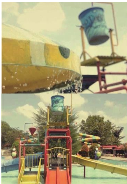
Gambar 3.4. Scene Preview Segmen3 dan 4