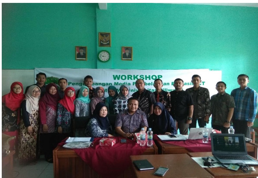
Gambar 4. Peserta Workshop Pengembangan Media Pembelajaran Berbasis ICT.

Dari awal pertemuan sampai akhir guru-guru terlihat sangat antusias mengikuti setiap kegiatan dalam workshop tersebut. Pada saat workshop guru-guru dikenalkan dan dilatih mengembangkan media pembelajaran berbasis ICT, sehingga guru-guru tidak kesulitan dalam menyampaikan materi pembelajaran dan hal ini akan berdampak pada meningkatnya pemahaman dan semangat belajar siswa.