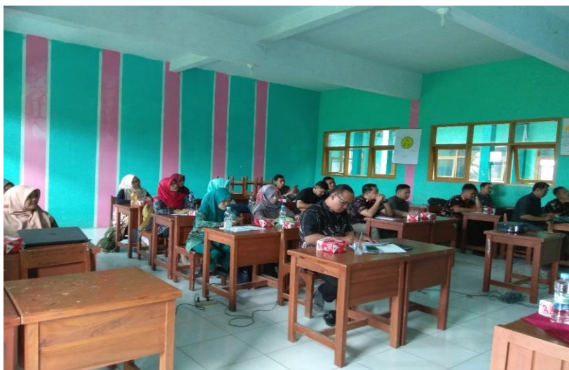
Gambar 2. Pemaparan Materi

Kegiatan pengabdian ini dibuka oleh Wakasek Kurikulum di SMK AS-Shofa. Setelah pembukaan, dilanjutkan dengan pengenalan dan pemaparan materi workshop yang pertama yaitu alat peraga yang berbasis IT dan relevan dengan kurikulum 2013 yang sedang dilaksanakan pada saat ini.