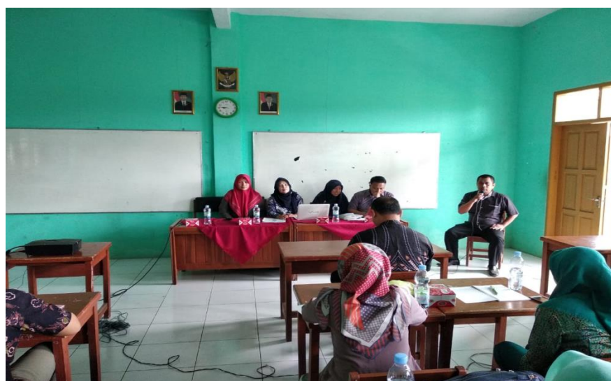
Gambar 1. Pembukaan Kegiatan Workshop

Kegiatan pelatihan dan lokakarya maupun workshop ICT bagi guru yang mengintegrasikan ICT di dalam kurikulumnya dapat meningkatkan keterampilan ICT dan keinginan mereka untuk mengintegrasikannya di dalam proses belajar mengajar. Oleh karena itu workshop pengembangan media pembelajaran berbasis ICT sangat diperlukan.