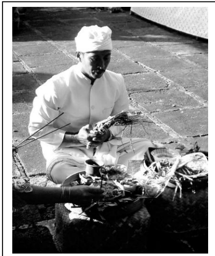
Aktivitas Pemangku saat matur piuning ke Dang Kahyangan.