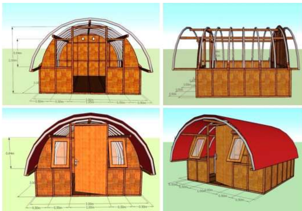
Gambar 1. Sketsa konsep hunian sementara lumbung bambu

Konsep huntera lumbung bambu ini dibuat dengan mengadopsi rumah tradisional Lombok yang berbentuk lumbung menggunakan bahan kayu usuk dan pipa paralon dengan dinding anyaman bambu (bedek). Teknik pembuatan cukup sederhana; semua kerangka bangunan terbuat dari kayu usuk 4/6 dan atap dari pipa pvc ukuran 3/4 inci. Atap dibuat dari karpet talang air yang disusun sedemikian rupa sehingga berfungsi sebagai atap. Dinding bangunan terbuat dari anyaman bambu. Luas rumah adalah 3 x 3 meter untuk panjang dan lebar serta tinggi 2,5 meter. Lantai terbuat dari tanah urug yang sekelilingnya diberi pasangan bata setinggi 20 cm dan bagian atas dilapisi campuran pasir dan semen. Konsep hunian sementara berbentuk lumbung bambu ini dapat dilihat pada Gambar 1.