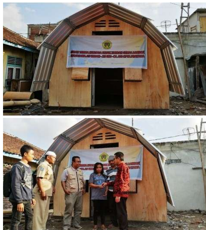
Gambar 4. Penyerahan hunian sementara kepada warga penerima bantuan

Kerangka utama bangunan dibuat dari bahan baja ringan dengan pertimbangan untuk kemudahan transportasi dan pemasangan. Dinding terbuat dari material plywood yang langsung disatukan dengan kerangka baja sebagai panel-panel terpisah yang bisa dirangkai dilapangan. Pembuatan kerangka dan pemasangan plywood sebagai panel dilakukan di workshop mitra kerjasama. Proses persiapan bahan dan pembuatan panel ini memerlukan waktu 3 hari dengan tenaga kerja sebanyak 3 orang. Salah satu prototipe desain dibangun langsung dilokasi korban gempa. Setelah semua proses persiapan lahan, perakitan sampai akhirnya finishing selesai dilakukan, maka selanjutnya hunian sementara tersebut diserahkan kepada warga oleh Dekan Fakultas Teknik Universitas Mataram seperti yang terlihat pada Gambar 4.