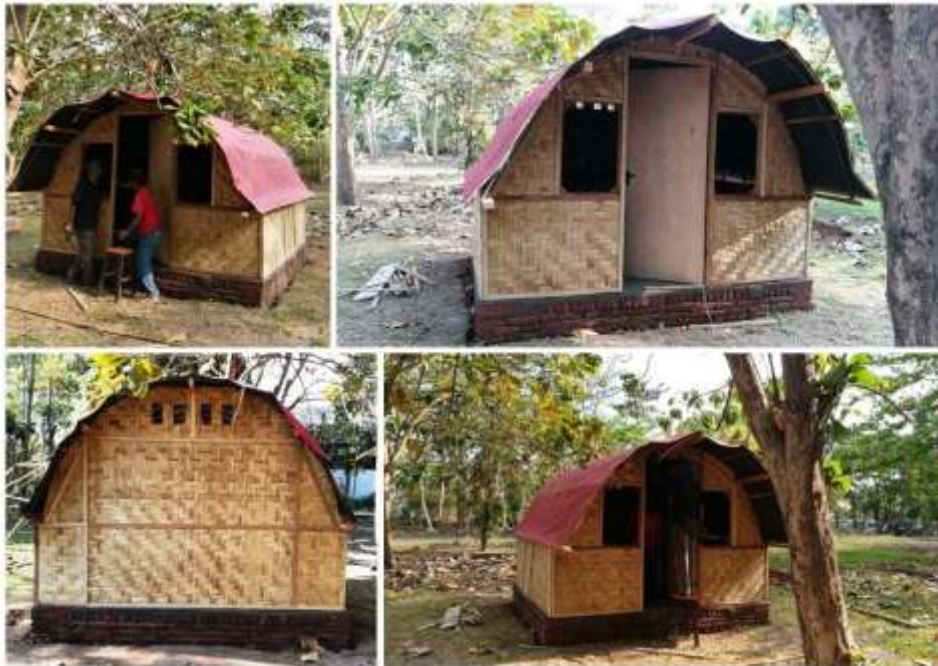
Gambar 2. Prototipe hunian sementara yang sudah siap dihuni

kisi memungkinkan udara bersirkulasi dengan baik. Prototipe bangunan yang sudah jadi dapat dilihat pada Gambar 2.