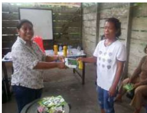
Gambar 2. Penyerahan Benih dan Peralatan Pelatihan

Persiapan bahan dan peralatan dilaksanakan dalam 2 tahapan yakni pada awal kegiatan dan saat kegiatan penyuluhan dilakukan. Persiapan ini meliputi pengadaan benih-benih sayuran, peralatan budidaya untuk persiapan tanam dan pengadaan bahan dan peralatan pendukung untuk pembuatan pupuk organik. Selanjutnya benih sayuran dan mulsa tersebut diserahkan kepada mitra beserta anggotanya untuk selanjutnya dilakukan persiapan tanam pada lahan masing-masing anggota.