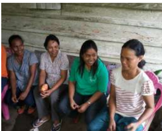
Gambar 1. Diskusi Awal Bersama Anggota Kelompok

Tahap awal pelaksanaan program pengabdian ini dilakukan dengan menyusun rencana kegiatan penyuluhan dan pelatihan, dalam bentuk diskusi awal bersama mitra dan anggota. Selanjutnya dilakukan persiapan meliputi penyiapan bahan dan peralatan penyuluhan dan pelatihan.