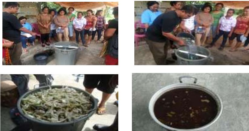
Gambar 7. Proses Pembuatan Pupuk Organik Cair

Peserta yang hadir dalam pelatihan ini sangat antusias, terlihat dari respon peserta yang disampaikan lewat pertanyaan-pertanyaan yang dilontarkan. Manfaat yang diperoleh anggota kelompok dari pelatihan ini adalah mampu memproduksi sendiri dan menyediakan pupuk organik untuk memenuhi kebutuhan tanaman, menekan ongkos produksi karena tidak lagi mengeluarkan biaya untuk membeli pupuk.