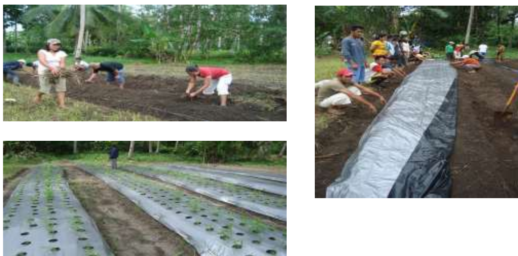
Gambar 9. Pembuatan Demplot Sayuran Organik

Lahan sayuran yang telah ditanami selanjutnya dirawat oleh peserta yang meliputi penyiraman, pemupukan, pengendalian gulma, pengendalian hama dan penyakit. Semua kegiatan tersebut dilakukan dibawah pemantauan tim.