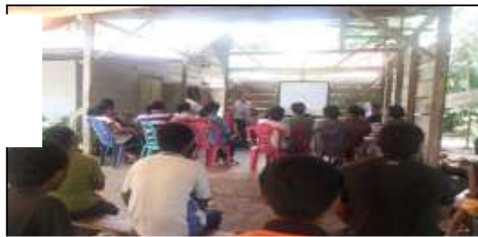
Gambar 3. Penyuluhan Budidaya Sayuran Organik

Sebelum dilakukan penyuluhan tim terlebih dahulu membagi daftar pertanyaan kepada mitra dan anggota untuk dilakukan penggalian informasi tentang pengetahuan budidaya sayuran organik. Kegiatan kemudian dilanjutkan dengan penyampaian materi budidaya sayuran organik, yang dilakukan melalui metode penyuluhan dan diskusi. Beberapa hal penting yang disampaikan mengenai teknik budidaya antara lain kegiatan persiapan lahan, media tanam, jenis-jenis pupuk organik, teknik pembibitan, pindah tanam, pengendalian hama dan penyakit, pemupukan dan pengendalian gulma. Setelah pelaksanaan penyuluhan budidaya sayuran organik anggota akan mempraktekkan secara bersama pada lahan demplot yang telah disediakan. Selain itu tim juga memperkenalkan jenis jenis pupuk organik kepada anggota antara lain pupuk kandang, pupuk hijau, dan kompos.