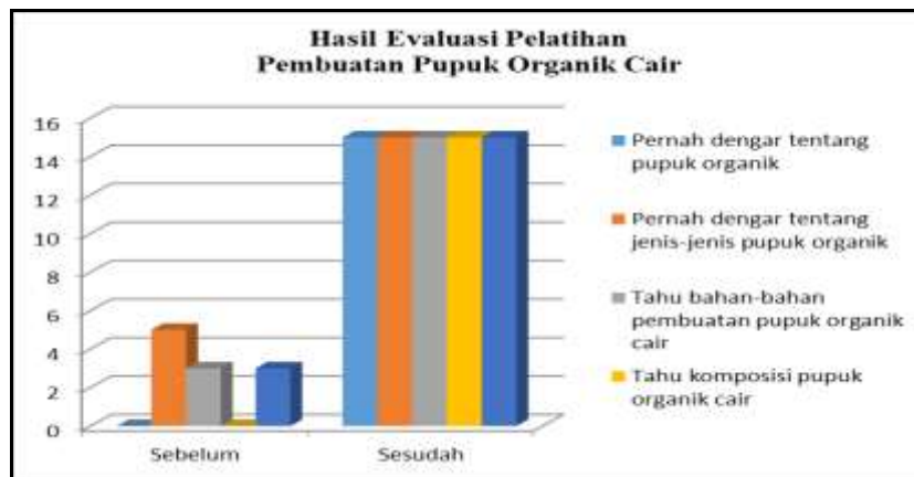
Gambar 8. Hasil Evaluasi Pelatihan Pembuatan Pupuk Organik Cair

Pelatihan pembuatan pupuk organik cair diakhiri dengan pembagian kuisisioner untuk mengevaluasi pengetahuan dan keterampilan terhadap kegiatan yang telah dilakukan. Hasil evaluasi menunjukkan terjadi peningkatan dan keterampilan pengetahuan sesudah peserta mengikuti kegiatan pelatihan pembuatan pupuk organik cair, baik menyangkut jenis-jenis, komposisi bahan yang terkandung, dan cara pembuatannya. Hasil evaluasi secara detail dapat dilihat pada gambar 8 dibawah ini.