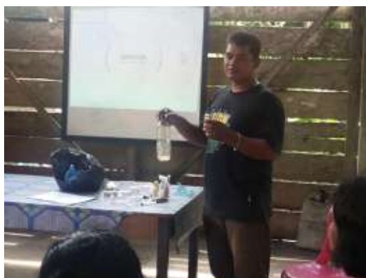
Gambar 5. Pelatihan Pembuatan Perangkap Lalat Buah

Pelatihan dilakukan bagi anggota kelompok, dimana setiap peserta diajarkan cara-cara membuat perangkap lalat buah dengan menggunakan peralatan sederhana seperti botol bekas minuman, kapas, kawat yang berfungsi sebagai pengikat, cairan sabun dan petrogenol yang berfungsi untuk menarik lalat buah masuk ke perangkap. Hasil pembuatan perangkap lalat buah selanjutnya di pasang di lahan pekarangan milik anggota sekaligus anggota secara langsung mengenali bentuk hama lalat buah.