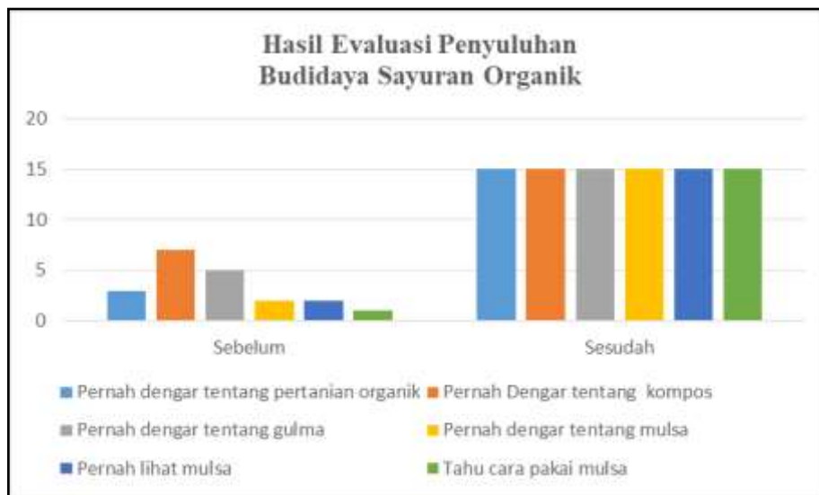
Gambar 4. Hasil Evaluasi Kegiatan Penyuluhan Budidaya Sayuran Organik

Setelah kegiatan penyuluhan dilaksanakan, selanjutnya dilakukan evaluasi terhadap peserta untuk mengetahui tingkat keberhasilan penyuluhan. Evaluasi dilakukan untuk mengukur tingkat pengetahuan peserta tentang budidaya sayuran organik. Hasil evaluasi ditampilkan dalam bentuk diagram pada gambar 4.