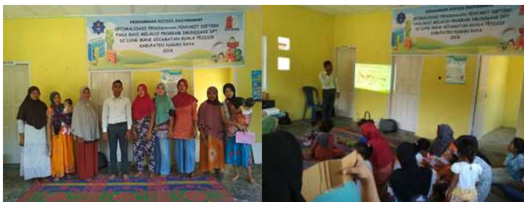
Gambar 1. Kegiatan Sosialisasi