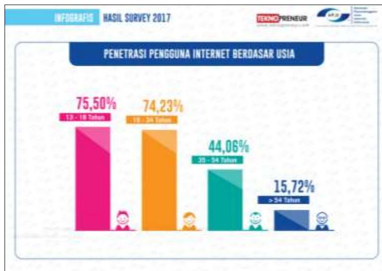
Gambar 5. Pengguna berdasarkan Usia

Kegiatan diskusi pada gambar 4 bertujuan untuk mengetahui perilaku atau kebiasaan yang sering dilakukan oleh para siswa dalam menggunakan smartphone . Hal yang didapat dari kegiatan diskusi dan dengar pendapat dengan para guru yaitu bahwa siswa lebih banyak menggunakan smartphone nya untuk mengakses media sosial. Sama halnya dengan pendapat para guru, survey dari APJII (Asosiasi Penyelenggara Jasa Internet Indonesia) yang dirilis pada tahun 2017 (APJII, 2017) menyatakan hal yang serupa. Hasil survey berdasarkan pengguna usia menunjukkan bahwa rentang usia sekolah menengah menunjukkan angka pengguna tertinggi. Hasil ini dapat dilihat pada gambar 5.