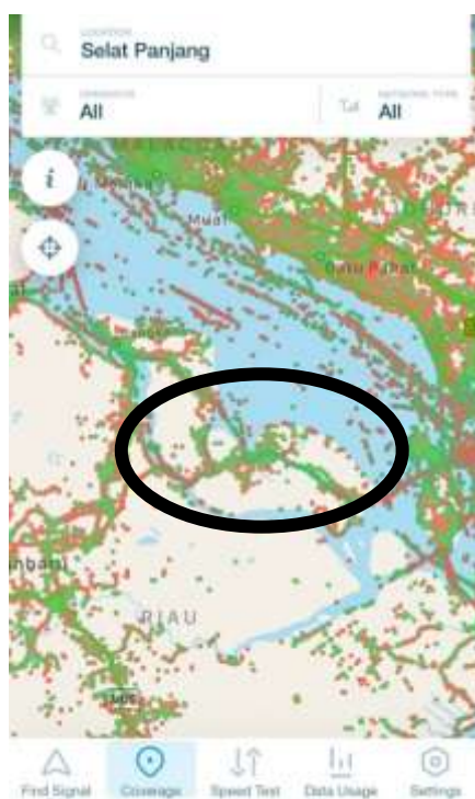
Gambar 3. Cakupan Ketersediaan Layanan Internet di Meranti.

Kegiatan penyuluhan akan berbentuk talk show dan diskusi terkait dengan pemanfaatan media sosial bagi pemilih pemula, lalu kegiatan akan dilanjutkan dengan diskusi agar para peserta dapat menanyakan hal-hal yang belum dipahami. Setelah kegiatan penyuluhan atau edukasi selesai dilakukan, tim pengabdian tetap membuka diri untuk konsultasi, diskusi atau tanya jawab secara personal terkait dengan pemanfaatan media sosial bagi para remaja yang berstatus pemilih pemula melalui media sosial seperti Whatsapp . Hal ini dilakukan agar mereka menjadi semakin paham dan siap dalam menghadapi pemilihan umum berbekal dengan informasi-informasi yang sudah mereka dapatkan.