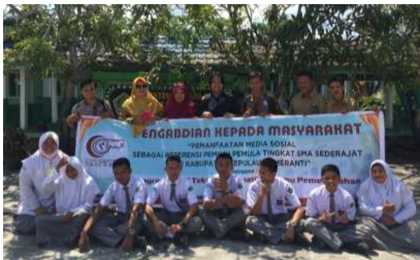
Gambar 8. Foto Bersama Setelah Sesi Diskusi

pengetahuan mereka seputar hal-hal yang berkaitan dengan pemanfaatan media sosial dalam mencari informasi terkait pemilihan umum bagi mereka yang berstatus sebagai pemilih pemula. Kegiatan diakhiri dengan foto bersama seperti pada gambar 8.