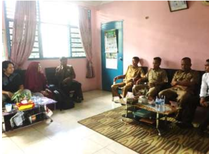
Gambar 4. Diskusi Dengan Para Guru

Kegiatan diskusi pada gambar 4 bertujuan untuk mengetahui perilaku atau kebiasaan yang sering dilakukan oleh para siswa dalam menggunakan smartphone . Hal yang didapat dari kegiatan diskusi dan dengar pendapat dengan para guru yaitu bahwa siswa lebih banyak menggunakan smartphone nya untuk mengakses media sosial. Sama halnya dengan pendapat para guru, survey dari APJII (Asosiasi Penyelenggara Jasa Internet Indonesia) yang dirilis pada tahun 2017 (APJII, 2017) menyatakan hal yang serupa. Hasil survey berdasarkan pengguna usia menunjukkan bahwa rentang usia sekolah menengah menunjukkan angka pengguna tertinggi. Hasil ini dapat dilihat pada gambar 5.