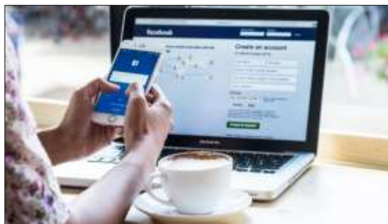
Gambar 1. Pengguna Mengakses Media Sosial Pada Perangkat Yang Berbeda

Media sosial merupakan sebuah media berbasis online, dengan para penggunanya bisa dengan mudah berpartisipasi, berbagi, dan menciptakan konten (Priambada, 2015). Saat teknologi internet dan mobile phone makin maju maka media sosial pun ikut tumbuh dengan pesat. Kini untuk mengakses media sosial, bisa dilakukan dimana saja dan kapan saja hanya dengan menggunakan smartphone , perangkat komputer, ataupun keduanya (Fitri, 2017) seperti yang terlihat digambar 1.