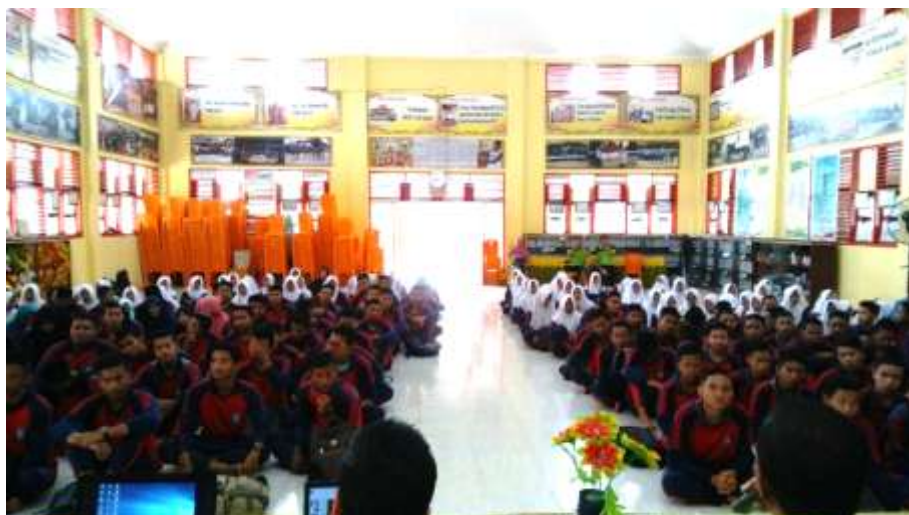
Gambar 7. Siswa Sedang Menyimak Materi Dari Tim Penyaji

Atas uraian dan gambar yang telah dijelaskan sebelumnya, bisa disimpulkan bahwa remaja usia sekolah menengah atas akan banyak meliterasi informasi yang mereka dapatkan dari media sosial. Kegiatan pengabdian ini berupa penyuluhan atau edukasi kepada para siswa tentang bagaimana memanfaatkan media sosial sebagai alternatif referensi sebagai pemilih pemula ke beberapa sekolah. Kegiatan dimulai dengan penjelasan dari tim pengabdian tentang pemilihan umum dan teknis tatacaranya. Penyuluhan dilanjutkan dengan informasi-informasi apa saja yang dapat dimanfaatkan dari media sosial terkait status mereka sebagai pemilih pemula, dan tentunya membekali mereka dengan bagaimana cara yang dapat dilakukan untuk menepis informasi yang sifatnya hoax atau terkait dengan black campaign di media sosial, seperti yang terlihat pada gambar 7.