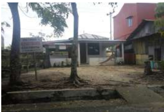
Gambar 2. Posyandu Bunga Tanjung

usia subur, ibu-ibu yang memiliki bayi usia 0-24 bulan, serta ibu hamil dapat memberikan ASI kepada anaknya.