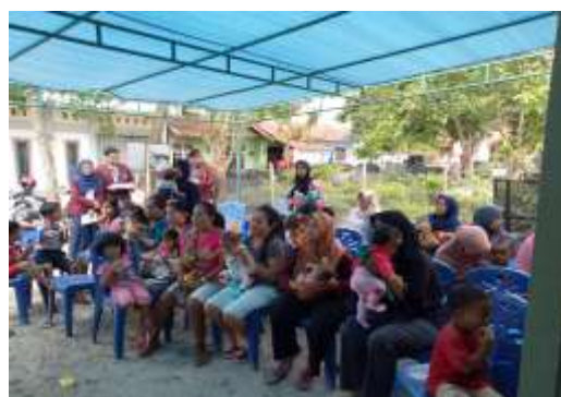
Gambar 3. Peserta Kegiatan Sosialisasi Pentingnya ASI Eksklusif Pada Bayi