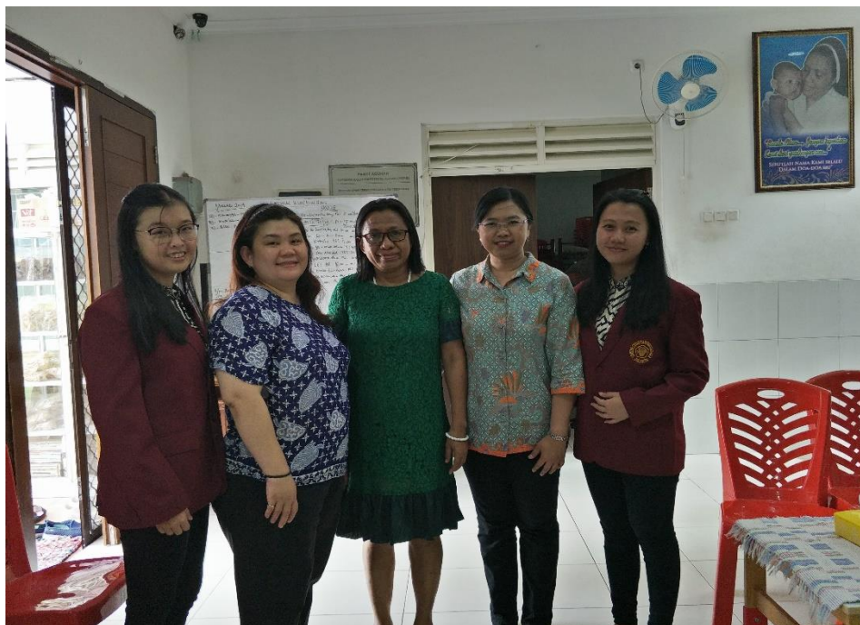
Gambar 5. Foto Bersama Tim PKM (Dosen dan Mahasiswa) dan Pengurus Yayasan Kasih Mandiri Bersinar

Kegiatan Pengabdian Kepada Masyarakat (PKM) ini didukung penuh oleh perguruan tinggi Universitas Tarumanagara melalui dana yang diberikan kepada tim PKM. Tim PKM adalah tim yang telah memperoleh sertifikasi dosen, sehingga setiap semester pasti akan melakukan Tri Dharma Perguruan Tinggi, salah satunya adalah kegiatan Pengabdian Kepada Masyarakat (PKM). Kegiatan PKM yang telah dilakukan tim selama empat tahun terakhir adalah kegiatan yang sesuai dengan spesialisasi bidangnya yaitu Akuntansi Keuangan, Perpajakan, dan Manajemen Keuangan. Spesialisasi bidang yang dimiliki tim dapat memberikan solusi bagi persoalan dan kebutuhan mitra