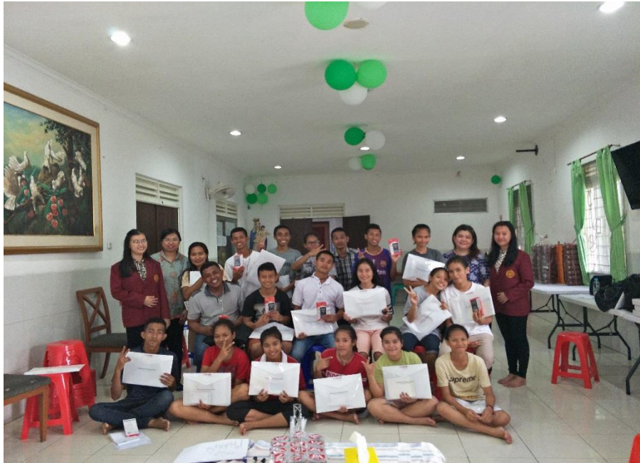
Gambar 4. Foto Bersama Tim PKM (Dosen dan Mahasiswa) dan Anak-Anak Yayasan Kasih Mandiri Bersinar