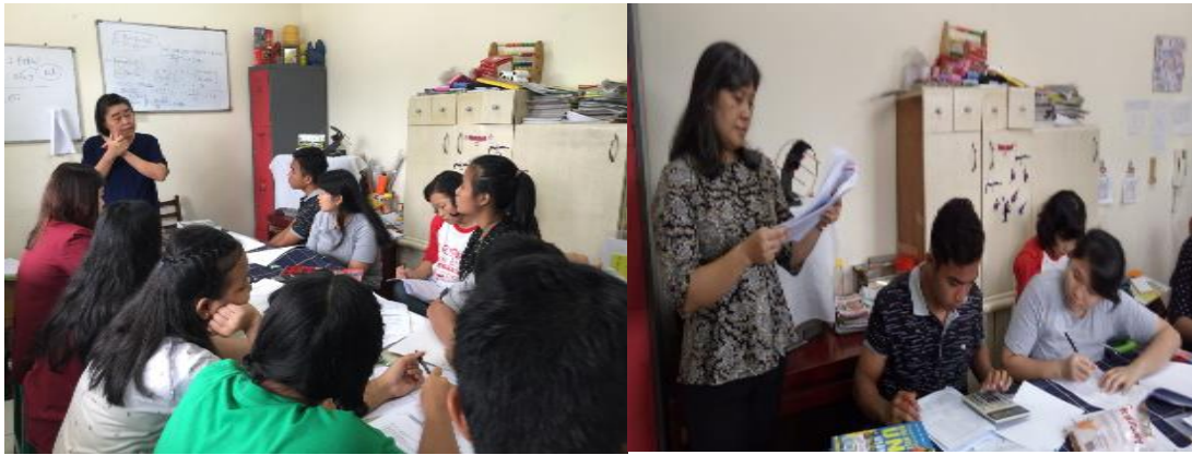
Gambar 4. Aktivitas Pelaksanaan PKM (2)

Kami berharap dengan pelatihan ini dapat membekali anak-anak panti untuk siap menghadapi UN, walaupun di samping itu diharapkan juga dapat membekali anak-anak panti untuk siap mengevaluasi kinerja wirausahanya.