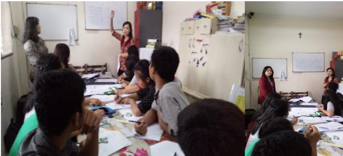
Gambar 3. Aktivitas Pelaksanaan PKM (1)

Aktivitas pelaksanaan PKM dapat dilihat pada Gambar 3 dan Gambar 4.