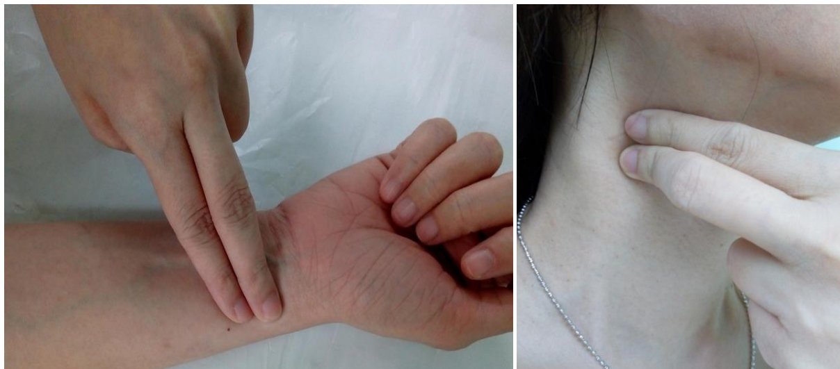
Gambar 3. Cara menghitung denyut nadi di pergelangan tangan dan leher.

Denyut nadi saat latihan harus dimonitor agar berada pada kisaran intensitas yang telah ditetapkan. Denyut nadi latihan dapat dimonitor secara sederhana dengan cara menghitung denyut nadi arteri Brachialis (di pergelangan tangan sisi luar) atau di arteri Karotis (di daerah leher) selama 1 menit. Pengukuran dapat dilakukan selama 10 detik (hasil dikalikan 6) atau selama 15 detik (hasil dikalikan 4). Contoh, bila selama 10 detik teraba denyut nadi sebanyak 17 maka denyut nadi 1 menit adalah 17 \times 6 = 102/\text{menit} (Gambar 3).