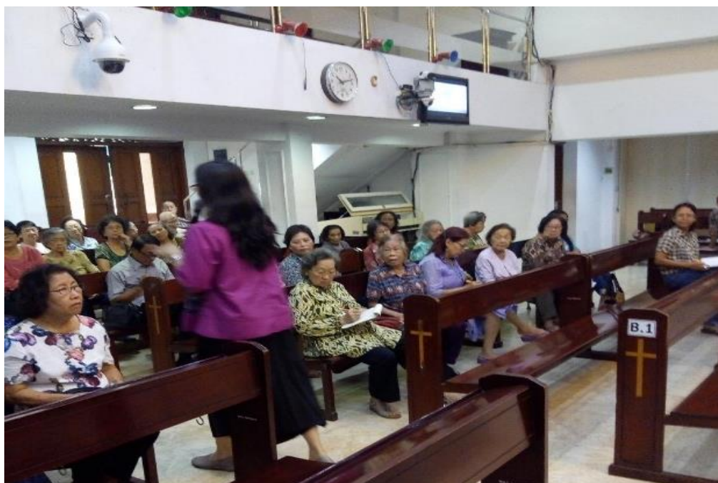
Gambar 4. Suasana penyuluhan.

Tidak semua pertanyaan yang diajukan oleh peserta berhubungan dengan materi penyuluhan (Gambar 4). Beberapa peserta mengajukan pertanyaan tentang terapi medikasi bagi keluhan lututnya yang sudah lama tidak membaik. Beberapa peserta mengajukan pertanyaan berhubungan dengan masalah gizi. Kebetulan salah satu peserta penyuluhan adalah guru besar ilmu gizi Fakultas Kedokteran Universitas Indonesia sehingga pertanyaan terkait masalah gizi dapat dijawab oleh beliau.