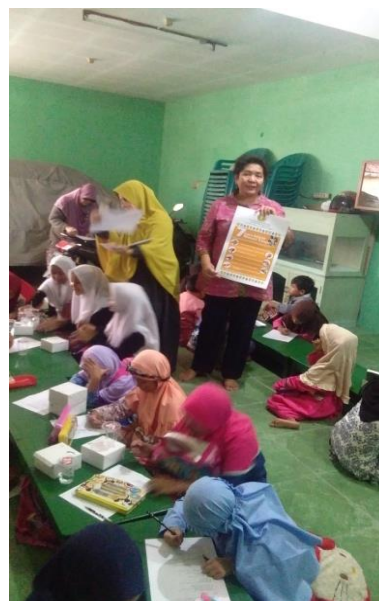
Gambar 4. Foto kegiatan