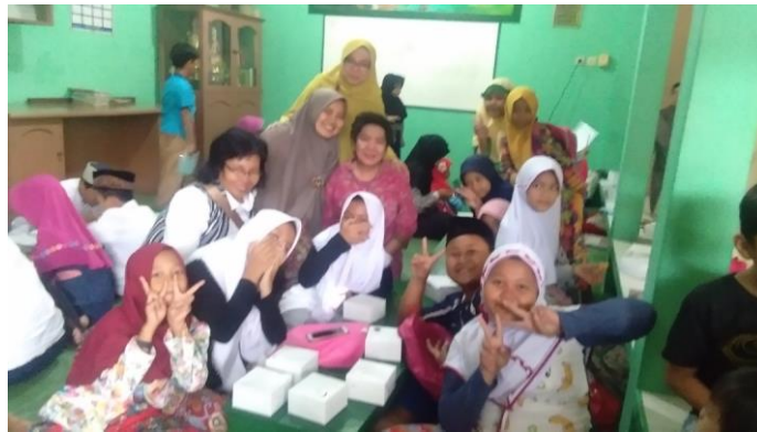
Gambar 3. Foto-foto kegiatan

Waktu yang tepat dan benar untuk melakukan cuci tangan: Sebelum dan sesudah makan, Sebelum dan sesudah menyiapkan makanan, Sebelum dan sesudah mengganti popok bayi, Sebelum memasang lensa kontak, Sebelum merawat luka, Setelah ke toilet (buang air besar atau kecil), Setelah bersin atau batuk, Setelah menyentuh binatang, Setelah memegang sampah, Setelah bersentuhan dengan benda-benda di khalayak ramai seperti uang, gagang pintu, pegangan bus, alat absensi sidik jari, pegangan jembatan, tombol lift, dan lain-lainnya (Risnawaty, 2016).