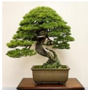
Gambar 3. Bonsai Sedang

Bonsai berukuran sedang disebut juga dengan chiu bonsai yang berukuran 30 – 60 cm. Jenis bonsai ini mudah ditangani. Perbandingan tinggi tanaman dengan pot adalah 3 : 1. Biasanya bonsai ini diletakkan di sudut ruangan yang cukup mendapat cahaya matahari.[1]