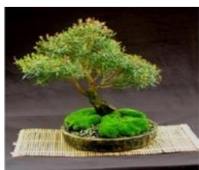
Gambar 4. Bonsai Kecil

Bonsai berukuran kecil disebut juga dengan ko bonsai yang berukuran 15 – 30 cm. Jenis bonsai ini banyak digemari oleh masyarakat di Indonesia. Bonsai kelompok ini tingginya mencapai tiga kali tinggi pot[1].