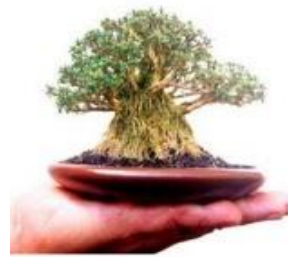
Gambar 5. Bonsai Sangat Kecil

Bonsai berukuran sangat kecil disebut dengan mame bonsai. Bonsai sangat kecil berukuran 5 – 15 cm. Bonsai mini dengan pot yang sangat kecil sekarang mulai populer karena dapat dipajang di atas meja tamu[1].