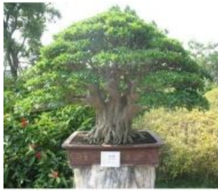
Gambar 2. Bonsai Besar

Bonsai berukuran besar disebut juga dengan dai bonsai yang berukuran 60 – 90 cm. Bonsai ini tidak mudah dipindah-pindahkan karena ukuran pot nya cukup besar dan berat. Biasanya bonsai jenis ini ditempatkan di teras atau kebun taman[1].