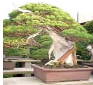
Gambar 1. Bonsai Sangat Besar

Bonsai berukuran sangat besar memiliki ukuran 90 – 150 cm. Bonsai ini hanya cocok di letakkan di tanaman[1].