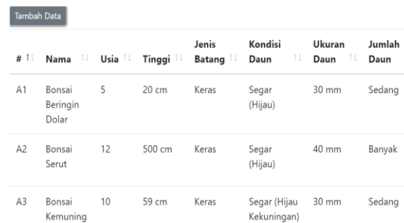
Gambar 6. Halaman pengelola alternative

Implementasi berfungsi untuk menampilkan antar muka dalam sistem pengambilan keputusan. dengan implementasi ini, maka pengaplikasian sistem pendukung keputusan akan lebih mudah penggunaannya dan lebih tepat hasilnya. Hasil dari implementasi dapat dilihat pada gambar berikut.