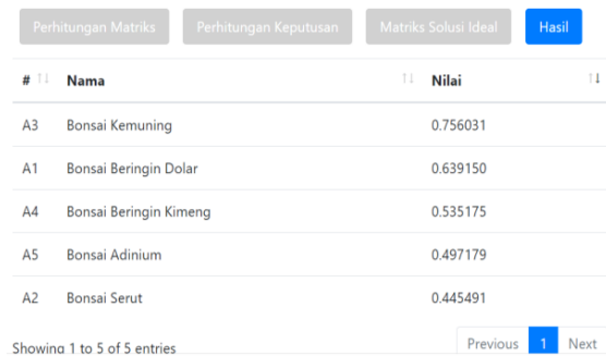
Gambar 9 Halaman proses dan hasil.