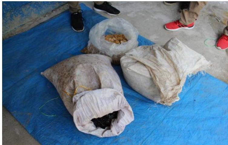
Gambar 3.1 Limbah Pertanian berupa kulit kopi

Kompos merupakan salah satu pupuk organik yang digunakan pada pertanian untuk mengurangi penggunaan pupuk anorganik. Penggunaan kompos dapat memperbaiki sifat fisik tanah dan mikrobiologi tanah. Kompos memiliki kandungan unsur hara seperti nitrogen dan fosfat dalam bentuk senyawa kompleks argon, protein, dan humat yang sulit diserap tanaman. Berbagai upaya untuk meningkatkan status hara dalam kompos telah banyak dilakukan, seperti penambahan bahan alami tepung tulang, tepung darah kering, kulit batang pisang dan biofertilizer (Dasumiati, 2015)