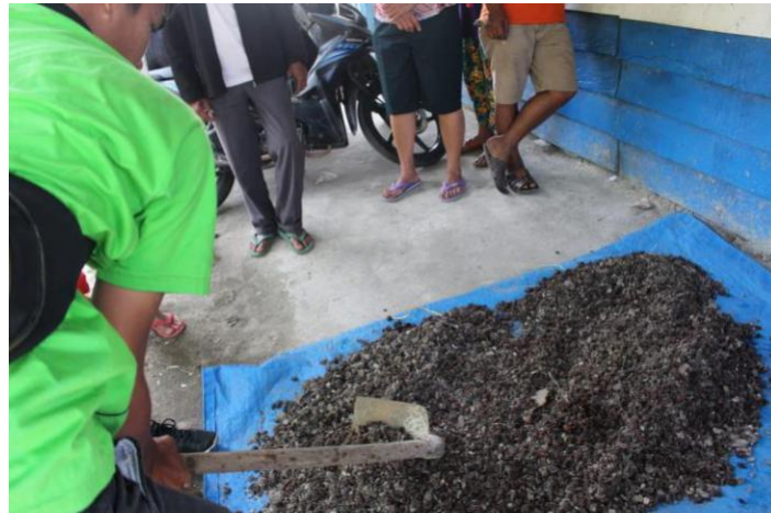
Gambar 3.3 praktik pembuatan kompos dari limbah pertanian

Berdasarkan program yang telah dilaksanakan, maka hasil yang di peroleh ialah Masyarakat menjadi tahu, mau dan mampu dalam mengolah dan memanfaatkan limbah pertanian.