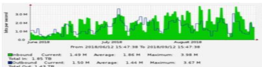
Gambar 1 Hasil monitoring jaringan WDS

Penelitian ini belum menjalankan keamanan jaringan melalui proses VAPT ( Vulnerability, Assessment, and Penetration Testing ) (Sahtyawan, 2019) karena penelitian ini memerlukan data riil pemakaian pengguna jaringan di lingkungan objek penelitian yang ada. Sehingga apabila terjadi serangan diharapkan menjadi masukan untuk rancangan penelitian berikutnya.