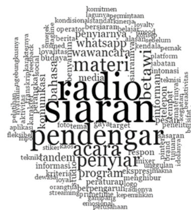
Gambar 2. Awan kata dari Coding Komunikasi Penyiar

pendengar. Disinilah diperlukan seorang produser dan kreativitas yang tinggi dari seorang penyiar. Radio adalah salah satu wadah untuk menyampaikan semua informasi kepada pendengar, seperti Bens Radio yang mengangkat budaya Betawi dalam setiap konten siarannya. Maka informasi apa pun yang disampaikan penyiar Bens Radio, pasti akan mengedepankan budaya Betawi. Salah satunya adalah dengan menggunakan bahasa Betawi serta celotehan khas orang Betawi. Pendengar sendiri mempunyai arti yang sangat besar bagi kehidupan sebuah radio, seperti halnya Bens Radio. Tanpa adanya pendengar, maka dipastikan sebuah radio tidak akan berjalan sebagaimana mestinya.