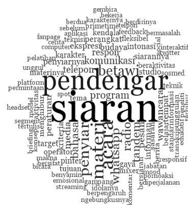
Gambar 1. Awan kata dari coding penyiar

Menggunakan aplikasi NVivo 12 Plus berikut word cloud (awan kata) yang muncul dari coding yaitu kata “penyiar”. Penyiar adalah orang yang menyampaikan pesan siarannya kepada pendengar, berupa informasi berita, olahraga, hiburan, religi, entertainment dan sebagainya dalam bentuk yang ringan dan menghibur. Pada penelitian ini peneliti mewawancarai 5 (lima) orang penyiar Bens Radio untuk memberikan keterangan yang peneliti inginkan. Mereka adalah OB, IDP, AT, FB, AO dan keterangan dari mereka jika di coding akan muncul di word cloud (awan kata) seperti berikut;