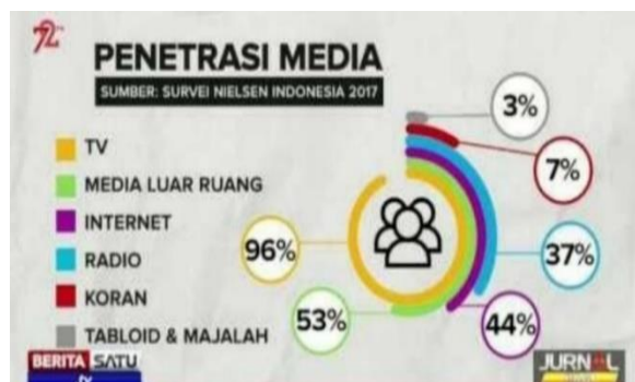
Gambar 6. Survei Nielsen Indonesia Mengenai Penetrasi Media 2017

Jadi bisa dikatakan bahwa masih ada yang mendengarkan radio di zaman digital saat ini. Terbukti dari beberapa survei yang ada, radio masih ada dalam posisi 5 (lima) besar bisnis media di Indonesia.