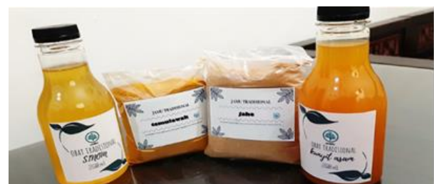
Gambar 4. Produk Minuman Herbal yang Dihasilkan

Peserta pelatihan diberikan kesempatan untuk dapat membuat sendiri salah satu produk minuman herbal yang telah dicontohkan sebelumnya. Hal ini diharapkan dapat langsung memberikan pengalaman kepada peserta dan segera mendiskusikan hal-hal yang dirasa menjadi kendala pada saat proses pembuatan minuman herbal. Penilaian pemateri terhadap peserta pelatihan sangat baik dikarenakan tingginya antusias peserta saat pemberian materi sampai dengan pelaksanaan pembuatan minuman herbal.