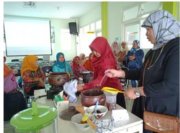
Gambar 3. Praktek Pembuatan Minuman Herbal

dan telah dicuci sebelumnya. Kemudian kegiatan dilanjutkan dengan pengemasan dan pelabelan produk minuman herbal.