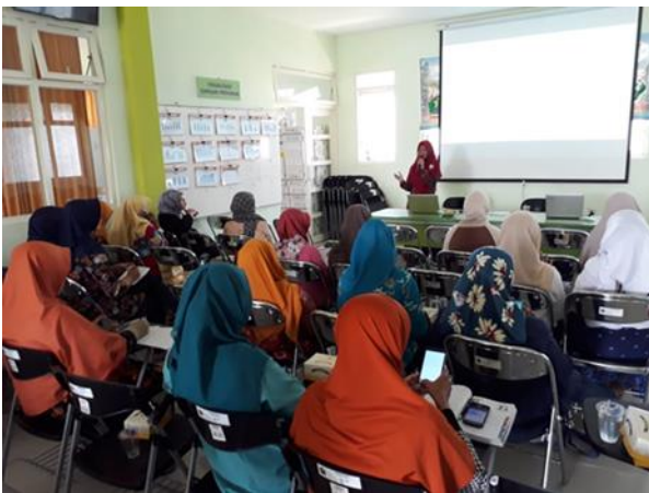
Gambar 2. Kegiatan Edukasi Minuman Herbal dengan Warga Mitra

Kegiatan selanjutnya adalah pemaparan cara pembuatan desain kemasan pada wadah yang akan digunakan pada saat proses pengemasan produk. Berdasarkan kegiatan peningkatan ilmu pengetahuan dan wawasan tentang minuman obat herbal modern peserta nampak sangat antusias mengikuti acara pertama tersebut. Hal ini dibuktikan dengan banyaknya respon pertanyaan yang diajukan oleh peserta seputar pembuatan minuman herbal berdasarkan pengalaman yang pernah dilakukan dan tips khusus pada saat proses produksi.