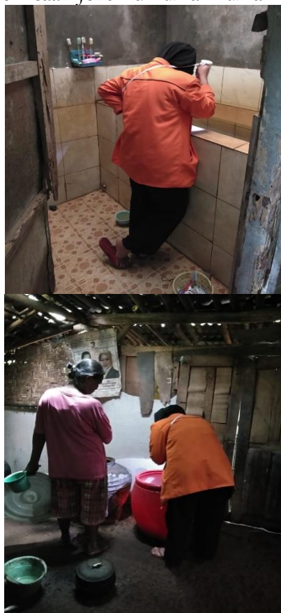
Gambar 3: Pemeriksaan Jentik di rumah-rumah warga