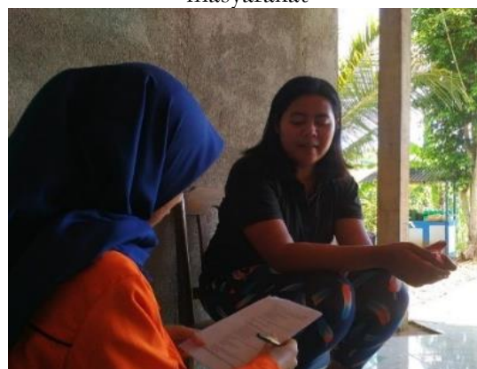
Gambar 2: Pengambilan data kuesioner di masyarakat

Setelah didapatkan Prioritas Masalah dan Usulan Program Kerja, dilakukanlah Kegiatan Musyawarah Masyarakat Dusun (MMD) dengan mendatangi aparat dusun Kedungpoh Kidul (Ketua RT, RW, Kepala Dukuh, dan Stakeholder ). Dengan dilaksanakan MMD, maka usulan program kerja disetujui oleh aparat dusun. Dari ketiga usulan program kerja, maka dilakukan kegiatan yang mengikut sertakan masyarakat.