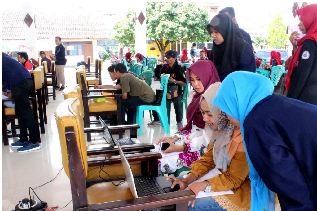
Gambar 4. Workshop Photo Editing dengan Adobe Photoshop di Kecamatan Gondang