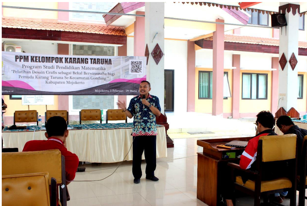
Gambar 5. Whorkshop Photo Editing dengan Adobe Photoshop di Kecamatan Gondang

Pelaksanaan kegiatan Program Pengabdian kepada Masyarakat oleh Tim Dosen Pendidikan Matematika Universitas PGRI Adi Buana Surabaya berjalan dengan lancar. Para peserta sangat antusias mengikuti setiap kegiatan yang sudah terjadwal. Kedatangan peserta selalu tepat waktu yaitu sepuluh menit sebelum kegiatan dimulai. Jika kegiatan melampaui batas waktu sholat dhuhur maupun sholat ashar maka kami mengadakan jeda untuk Ishoma (Istirahat, Sholat, Makan/Coffee break). Semua konsumsi dan coffee break telah disediakan Tim Panitia Dosen Pendidikan Matematika.