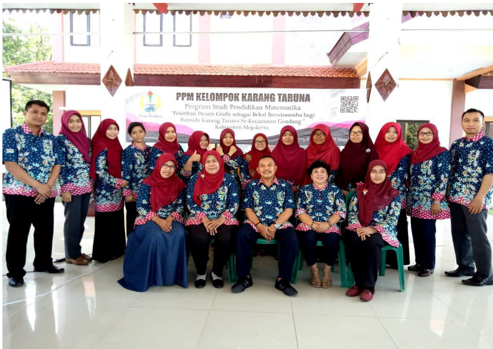
Gambar 2. Whorkshop Photo Editing dengan Adobe Photoshop di Kecamatan Gondang

Adapun kegiatan-kegiatan pelaksanaan PPM yang dilaksanakan di Kecamatan Gondang Kabupaten Mojokerto dapat dilihat pada Gambar 2, Gambar 3, Gambar 4, Gambar 5 berikut.