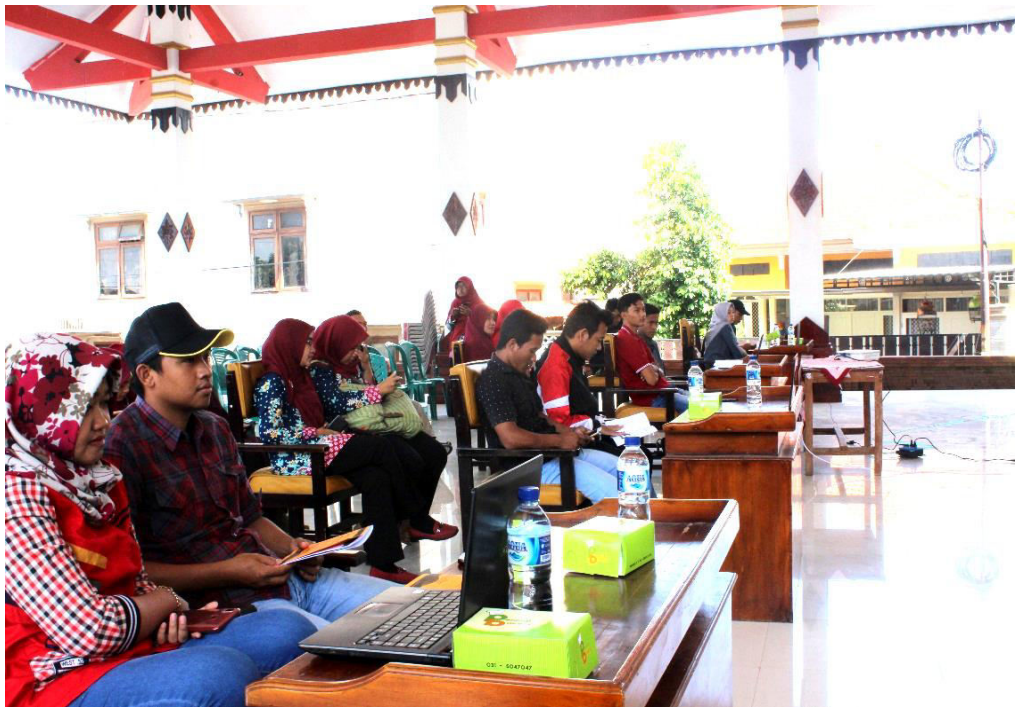
Gambar 3. Workshop Photo Editing dengan Adobe Photoshop di Kecamatan Gondang