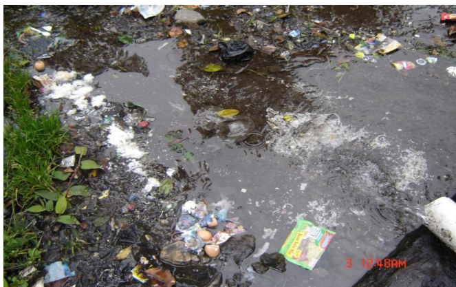
Gambar 1. Kondisi lingkungan yang kotor dengan sampah

Sikap pengunjung masih tidak ramah lingkungan seperti membuang sampah sembarangan, telah menyebabkan sebagian lingkungan TNGGP mejadi kotor. Di salah satu kali kecil air yang mengalir di sana juga tertihat sampah bekas bungkus mie instan, kulit telur, plastik bekas, bekas kaleng minuman dan sampah lainnya. Disamping merusak keaslian TNGGP juga menyebabkan pencemaran air yang juga di konsumsi oleh pengunjung lainnya.