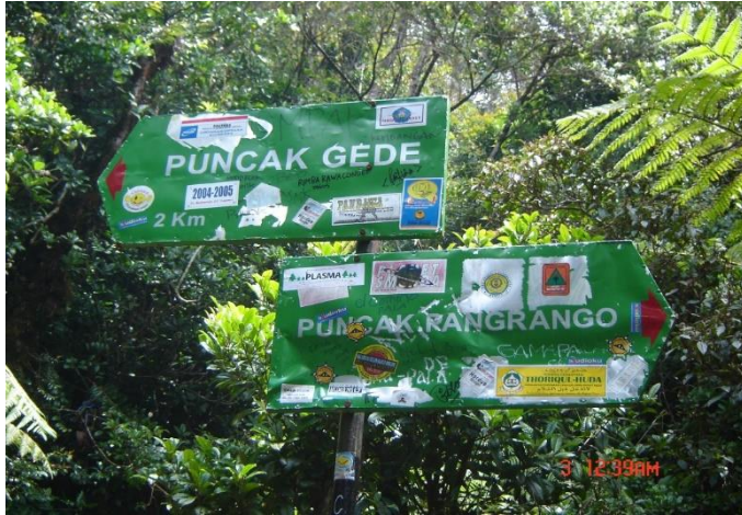
Gambar 2 Kondisi papan petunjuk arah yang di coret2 pengunjung

Berdasarkan pembahasan diatas, perlu dikaji kondisi, potensi ekologi, estetika dan ekonomi dari TNGGP sehingga dapat dirumuskan strategi bisnis ekowisata yang menerapkan prinsip-prinsip pembangunan berkelanjutan.