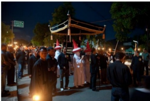
Gambar 6. Prosesi perarakan Tuan Ana oleh suku-suku yang ditugaskan secara turun temurun