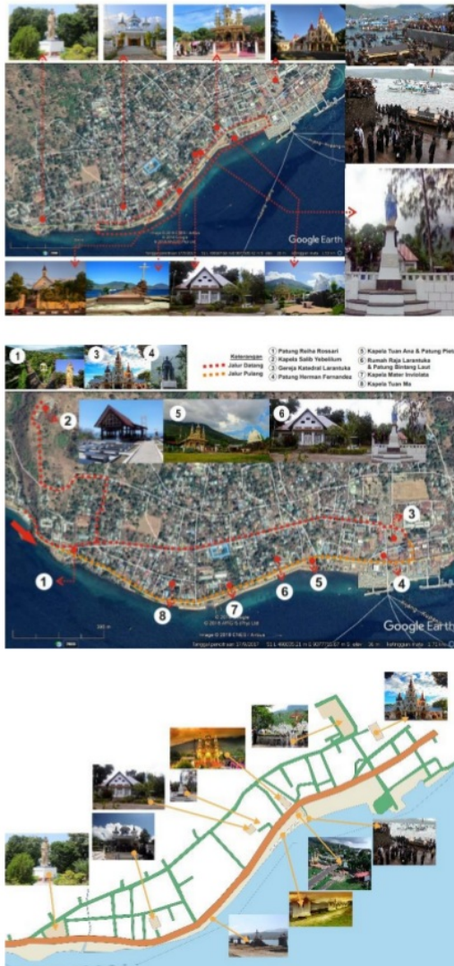
Gambar 5. Peta sebaran elemen-elemen kota ( node , edge , landmark , sculpture ) berupa sejarah Kota Larantuka sebagai Kota Reinha Rosari yang digunakan sebagai ruang publik sosial dan ruang publik sakral Semana Sancta