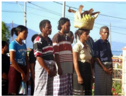
Gambar 11. Taman Pieta sebagai ruang publik sosial, dan religius adalah salah keberhasilan sacred public space dengan beragam ekspresi peziarah