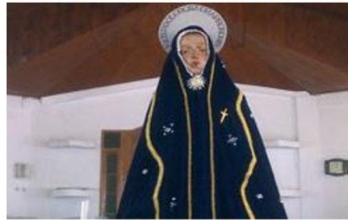
Gambar 7. Prosesi perarakan Tuan Ma oleh suku-suku yang ditugaskan secara turun temurun Sumber: (Muda, 2017; Mulyati, 2019)

Dari sejarah ringkas ritual Semana Sancta , terbukti bahwa Kota Reinha Rosari sebagai sacred public space dihasilkan dalam waktu yang lama, hingga ratusan tahun. Peran pemerintah dan suku-suku kerajaan Larantua jelas terlihat dalam pembentukan sacred space Kota Reinha Rosari . Ritual Semana Sancta yang awalnya hanya menjadi tradisi religius masyarakat lokal Kota Larantuka, kini menjadi daya tarik bagi para umat Katoli di seluruh Dunia. Perkembangan Kota Reinha Rosari sebagai sacred public space juga tidak lepas dari lokasinya yang strategis dan sejarah terbentuknya Kota Larantuka.