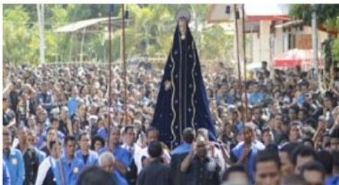
Gambar 3. Ritual Semana Sancta di ruang publik Kota Larantuka pada tahun 2010 (Mulyati, 2019)