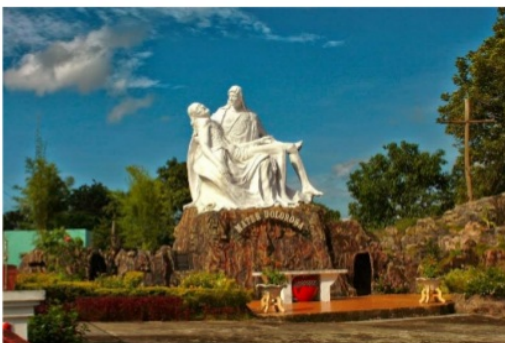
Gambar 9. Taman Pieta sculpture sebagai landmark Kota Reinha Rosari adalah ruang publik sakral yang menjadi area perhentian perarakan Tuan Ana dan Tuan Ma selama ritual Semana Sancta