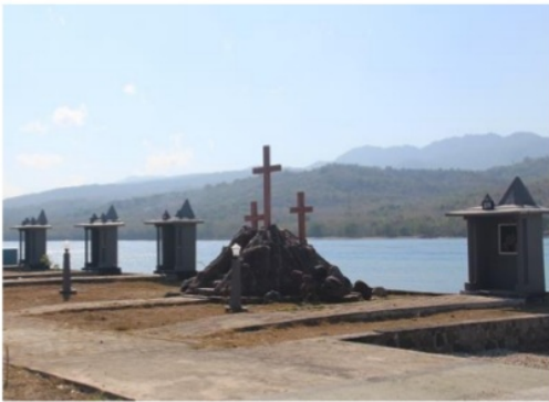
Gambar 8. Armida sculpture mewakili delapan suku Larantuka sebagai peringatan peristiwa Yesus

Sebuah sekuen ruang publik Kota Larantuka didesain sedemikian rupa sehingga pengunjung atau peziarah Kota Reinha Rosari bisa menyusuri ruang publik yang ada sekuen demi sekuen dengan space experience sejarah Semana Sancta . Ruas Jalan Yos Sudarso sebagai pedestrian utama prosesi Semana Sancta dibuat tikam turo oleh masyarakat Kota Larantuka yakni pagar bambu tempat lilin-lilin saat perarakan. Tikam turo makna "pagar" yang memberi rasa aman dan nyaman bagi peziarah dalam mengikut ritual Semana Sancta , sehingga Kota Reinha Rosari bukanlah sekadar publik space yang statis namun sakral sebagai simbol dari kehidupan ( passion ).