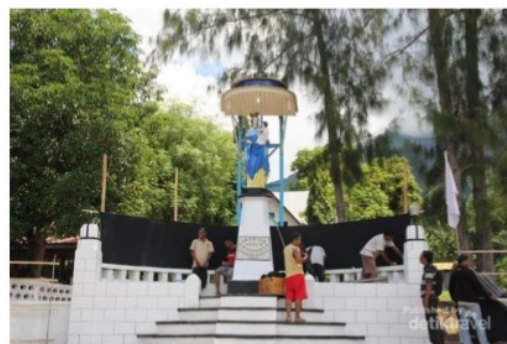
Gambar 10. Elemen-elemen pembentuk Kota Larantuka dikaitkan dengan sejarah ritual Semana Sancta sehingga menciptakan citra Kota Reinha Rosari

Reginaldo Christophori Lake, Yohanes Basuki Dwisusanto, Yohanes Djarot Purbadi, Fransiscus Xaverius Eddy Arinto: