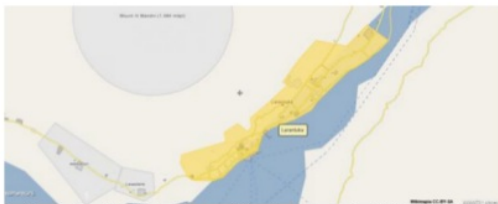
Gambar 2. Kota Larantuka tepat pada 8,4° Lintang Selatan dan 123° Bujur Timur