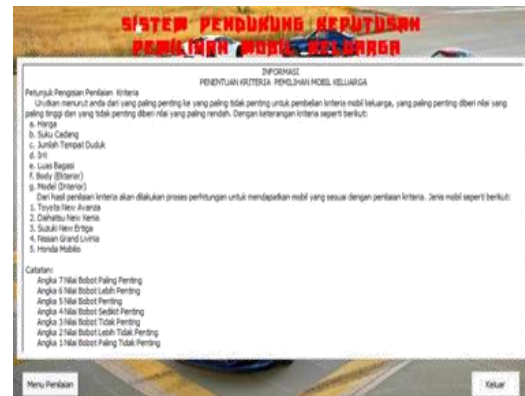
Gambar 2. Menu Home

terdapat tombol “Menu Penilaian” dan tombol “Keluar”.