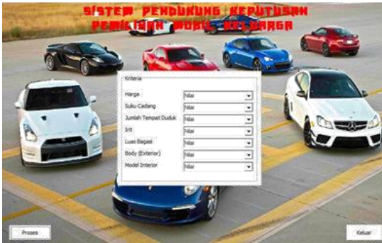
Gambar 3. Menu Penilaian